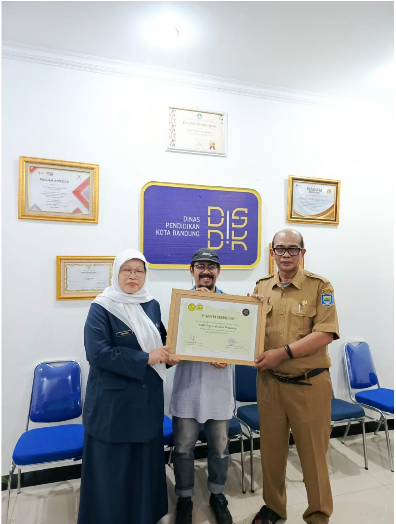
Dalam Rangka World Bicycle Day 2025, “Disdik Kota