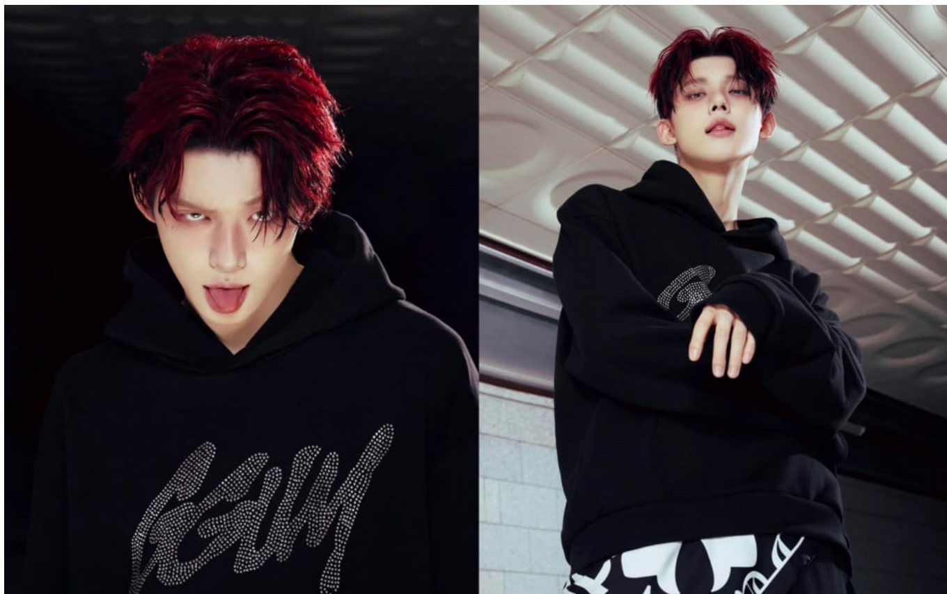
'GGUM' Yeonjun TXT

Rilisan solo Yeonjun dengan "GGUM" membuktikan bahwa dia adalah sosok yang sangat berbakat dan mampu membawa pengaruh besar di dunia musik.