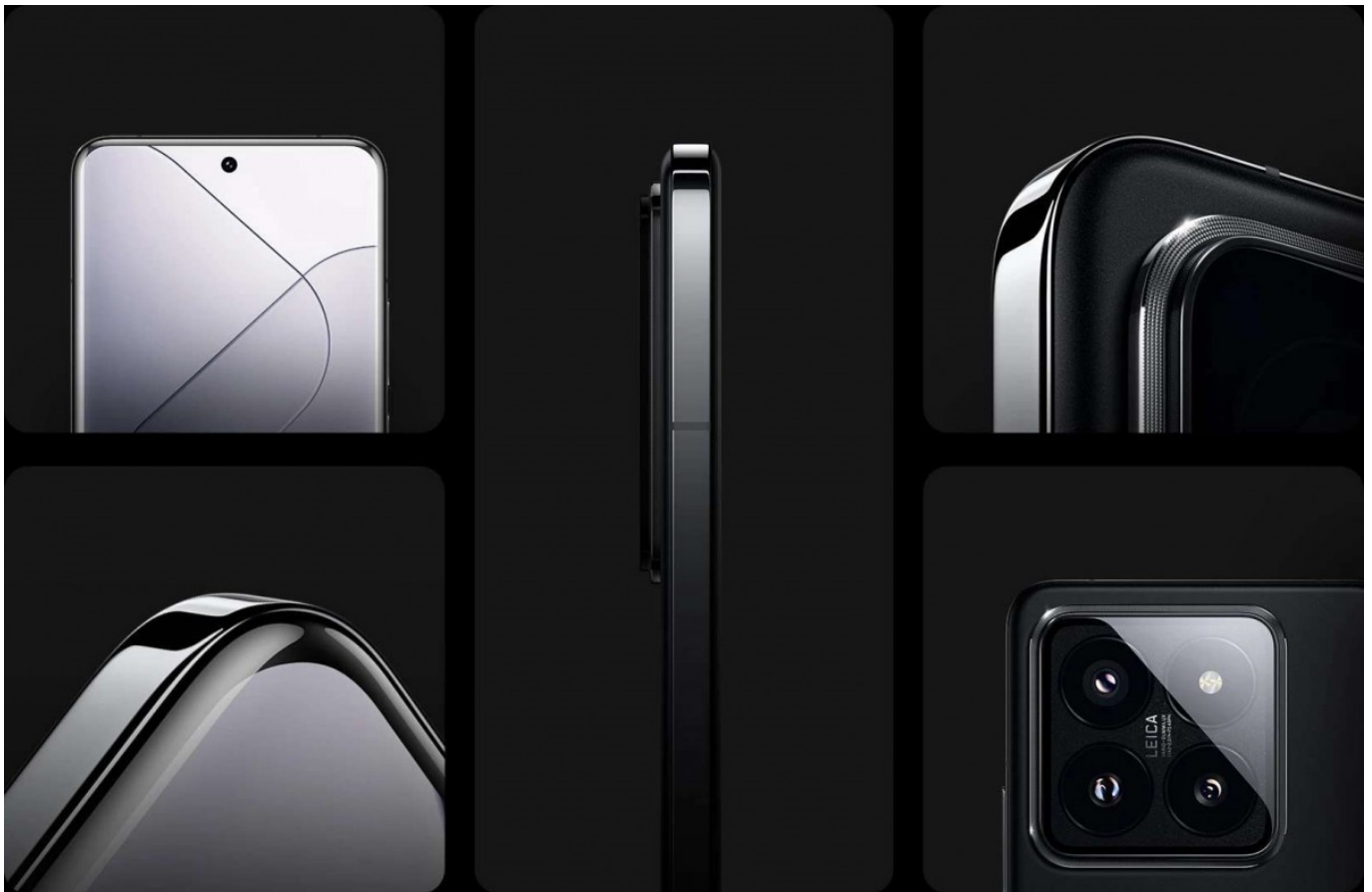
Bentuk Penampilan dari berbagai sudut Xiaomi 14 Pro

Seri ini menampilkan chipset Snapdragon 8 Gen 3 yang baru saja diumumkan, kamera utama bertanda Leica yang telah diperbarui, desain yang segar, serta HyperOS, sistem operasi terbaru dari Xiaomi.