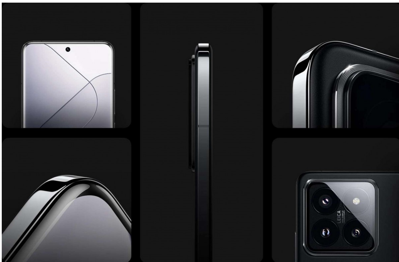
Bentuk Penampilan dari berbagai sudut Xiaomi 14 Pro

Seri ini menampilkan chipset Snapdragon 8 Gen 3 yang baru saja diumumkan, kamera utama bertanda Leica yang telah diperbarui, desain yang segar, serta HyperOS, sistem operasi terbaru dari Xiaomi.