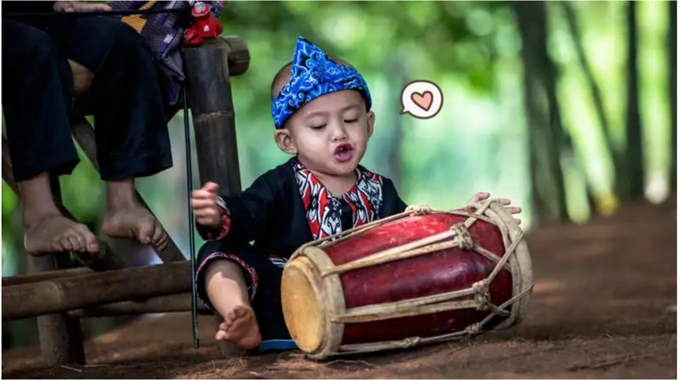
Ilustrasi anak sunda

Walaupun zaman sudah berubah, weton kelahiran masih menjadi bagian penting dalam kehidupan masyarakat Sunda hingga saat ini.