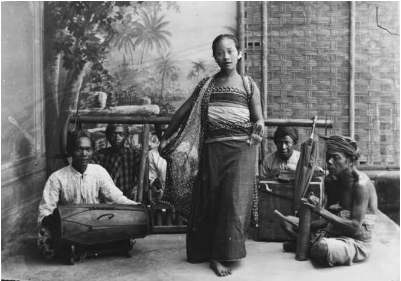
Ilustrasi masyarakat sunda - ist