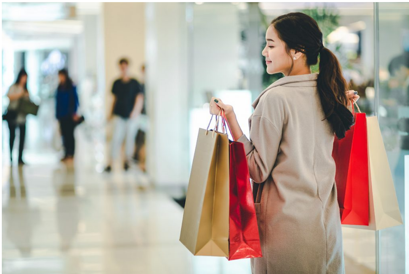
Ilustrasi - shutterstock

Selain kolaborasi seni yang keren banget, mereka juga punya banyak promo spesial lainnya buat kamu, di antaranya: