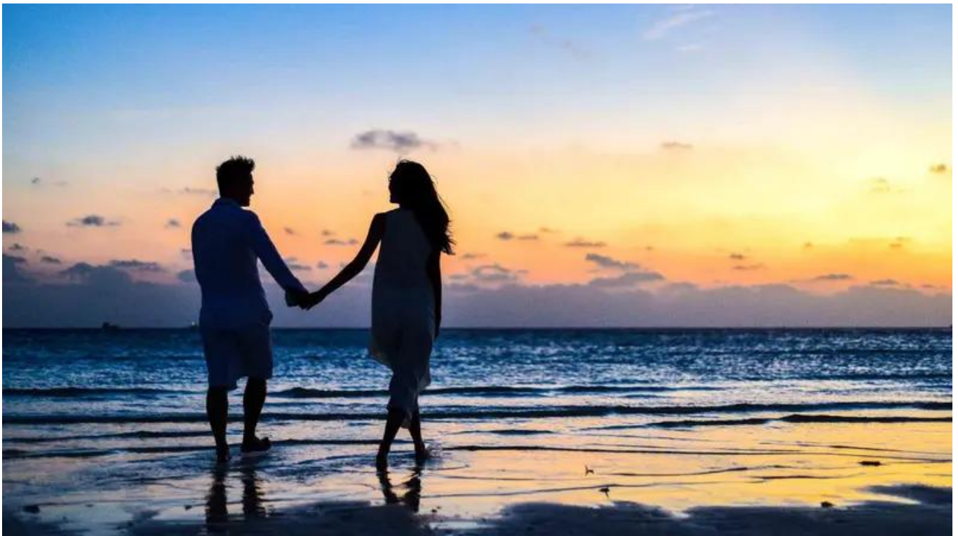
Triangular Theory of Love

Setiap hubungan punya keunikannya sendiri, dan nggak semua harus langsung mencapai “Consummate Love.” Yang penting, kamu dan pasangan saling mendukung dan mau bekerja sama untuk menciptakan hubungan yang lebih baik. Jadi, jenis cinta apa yang menggambarkan hubunganmu sekarang?