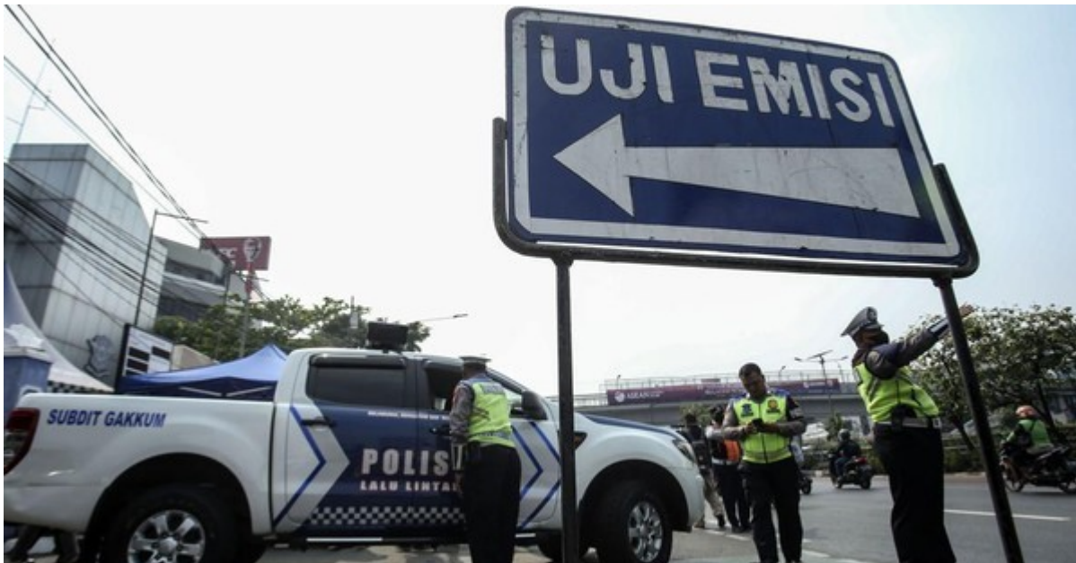
Potret uji emisi kendaraan dinas polisi

Keputusan untuk menghentikan kebijakan tilang kendaraan yang tidak lolos uji emisi mendapat respons positif dari sebagian besar masyarakat.