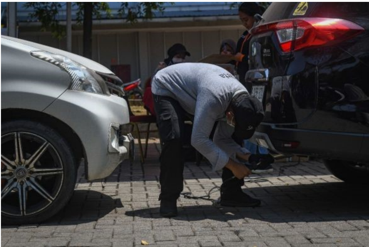
Seorang petugas sedang melakukan Uji Emisi pada kendaraan roda 4 – Aditya

Baca Juga:Fraksi Gerindra Dorong Pengelolaan Sampah Modern, Bandung Diminta Belajar dari PSEL Semarang