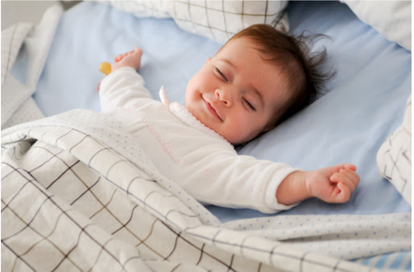
Ilustrasi bayi yang sedang tertidur

Kebutuhan tiap individu selalu berubah sepanjang berbagai fase kehidupan. Menurut National Sleep Foundation, waktu tidur yang dibutuhkan sebagai berikut :