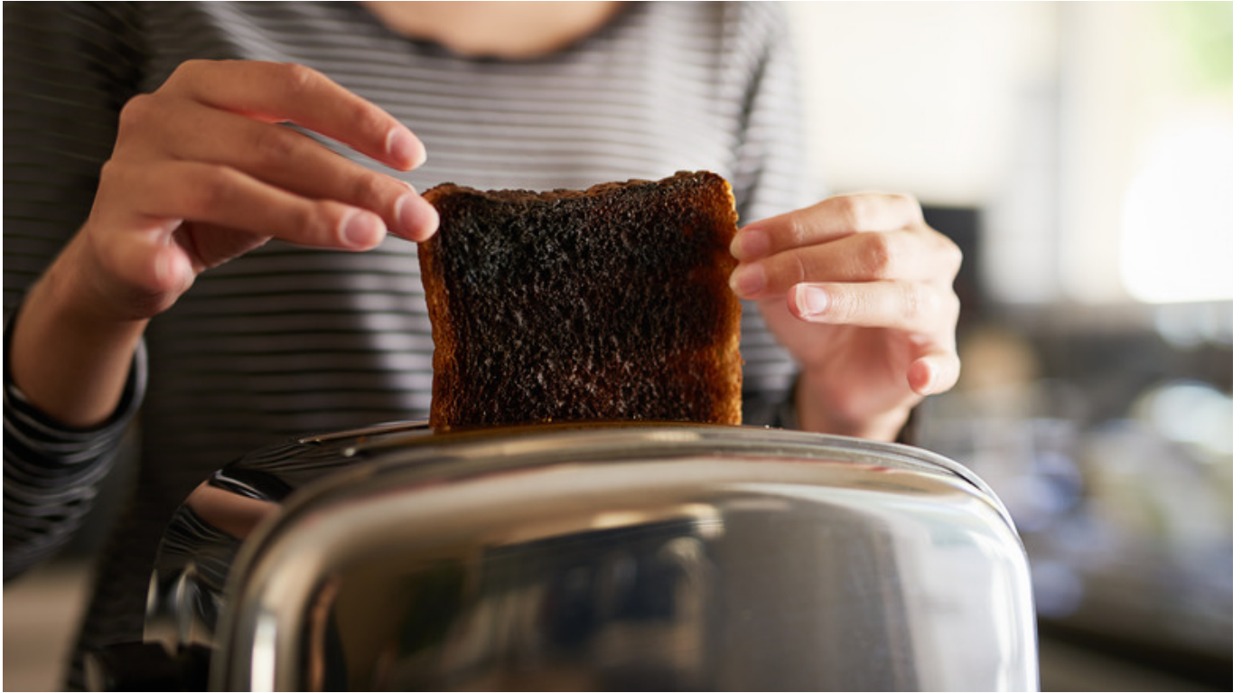
Ilustrasi roti panggang yang gosong - ist

The Burnt Toast Theory sebenarnya adalah cara berpikir yang mengajarkan kita untuk menerima hal-hal kecil yang tidak sempurna atau tidak sesuai dengan ekspektasi.