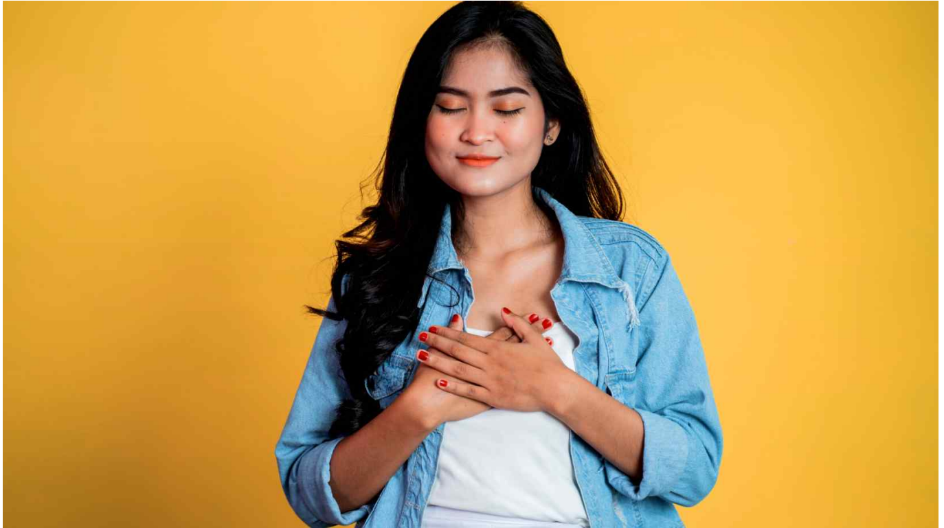
Ilustrasi belas kasih kepada diri sendiri

Nah, bagaimana kita bisa menerapkan kedua konsep ini dalam kehidupan sehari-hari? Berikut beberapa tips yang bisa kamu coba: