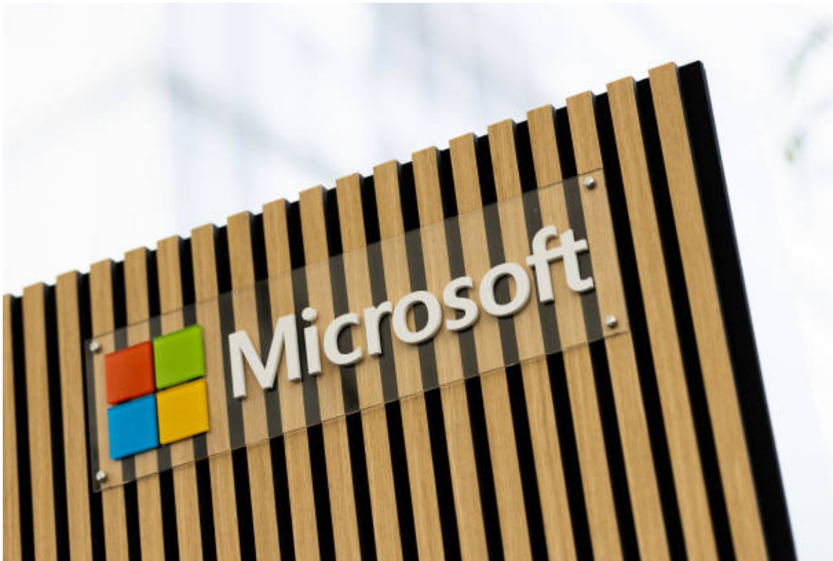
Logo Microsoft di Kongres Internet Digital X di Media Park

Pada Selasa mendatang, Microsoft diperkirakan akan melaporkan kenaikan pendapatan kuartal pertama hampir 9%, didorong oleh kekuatan dalam bisnis perangkat lunak