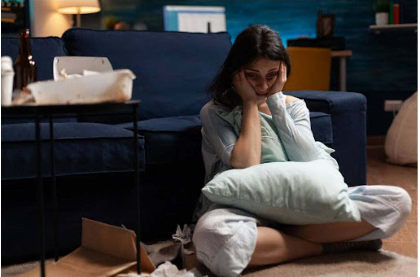
Ilustrasi wanita yang mengalami panic attack

Teknik grounding adalah cara yang simpel namun efektif untuk mengembalikan fokus dan ketenangan saat kamu merasa overwhelmed .