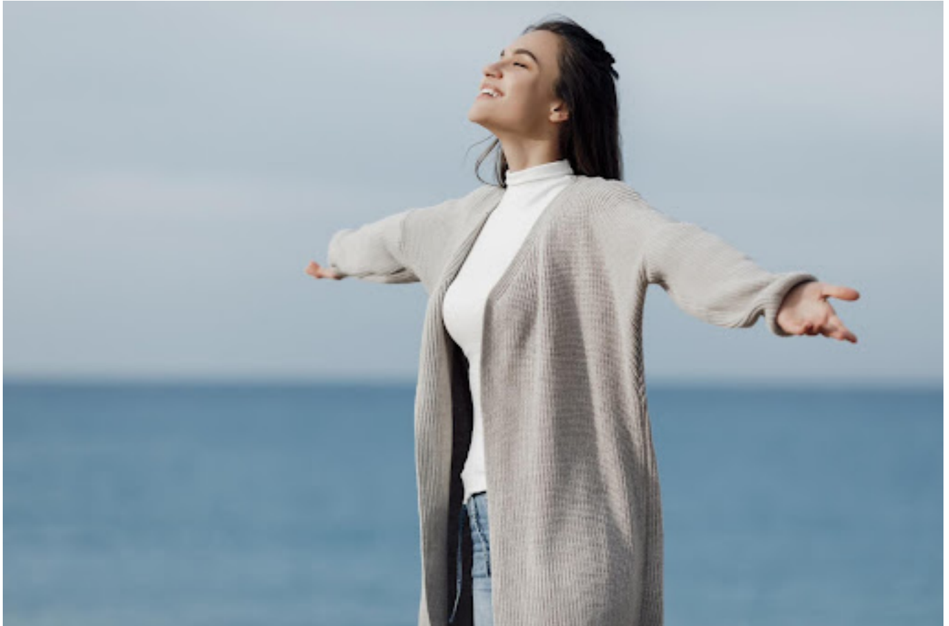
Ilustrasi wanita yang merasa bebas

Teknik grounding bisa sangat membantu saat panic attack karena ia bekerja dengan cara mengalihkan perhatianmu dari gejala yang menakutkan dan memfokuskan kembali pada lingkungan sekitarmu.