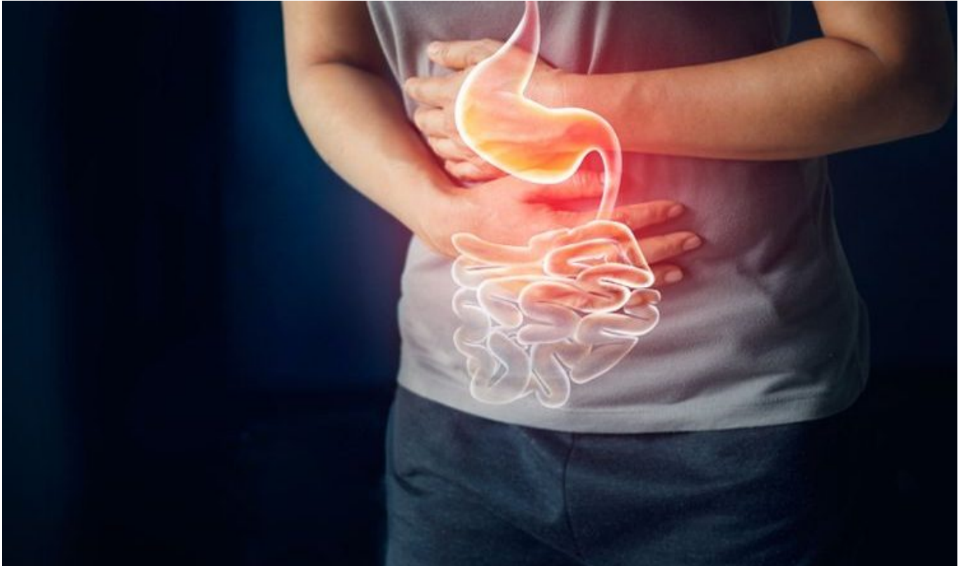
Penderita maag - Freepik