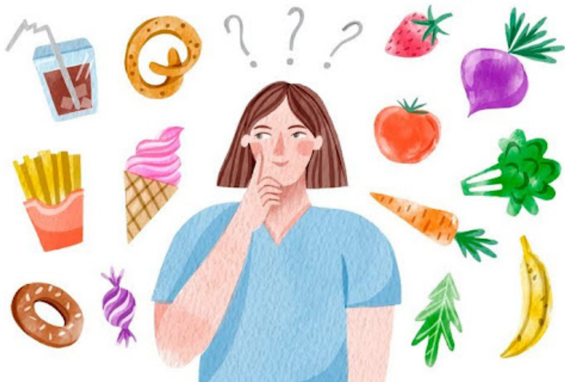
Ilustrasi memilih makanan yang sehat

Baca Juga: Resident Evil Requiem Meledak di 2026: Switch 2 Jadi Gerbang Baru Masuk ke Dunia Horor Capcom?