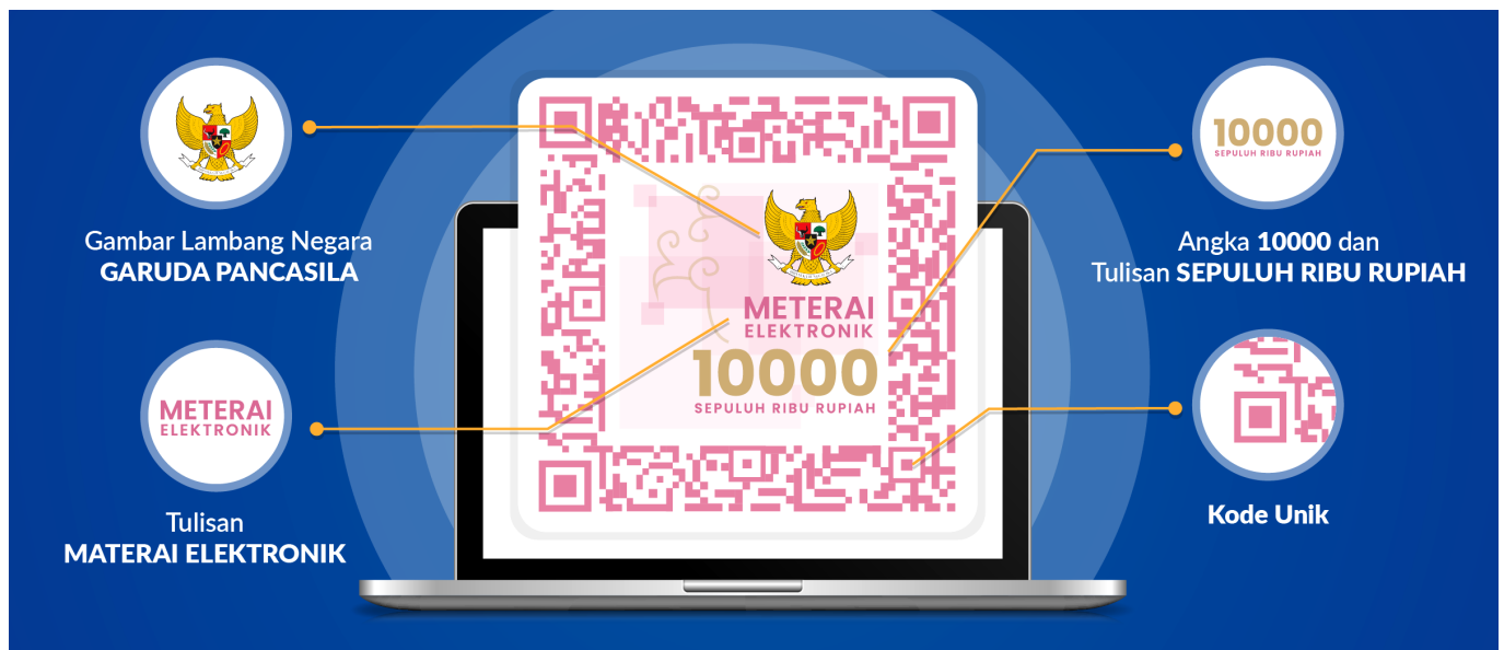
Ciri-ciri meterai elektronik - mitracomm

Cara untuk memeriksa keaslian e-Materai dapat dilakukan secara online melalui aplikasi Percetakan Uang Republik Indonesia (Peruri) atau melalui laman resmi Peruri.