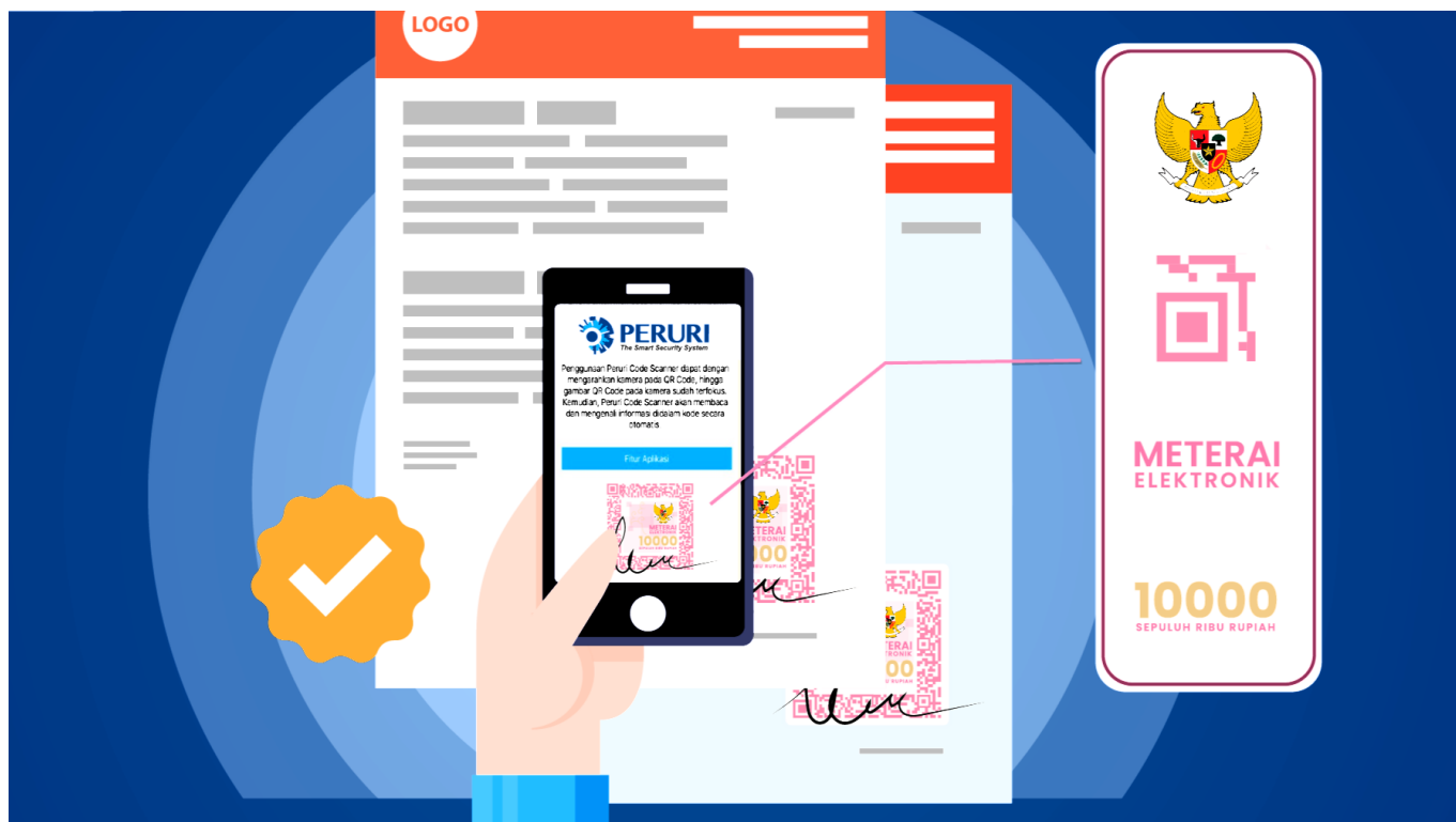
Cara cek keaslian meterai elektronik - mitracomm

Untuk memeriksa keaslian meterai elektronik, Anda dapat mengikuti langkah-langkah berikut: