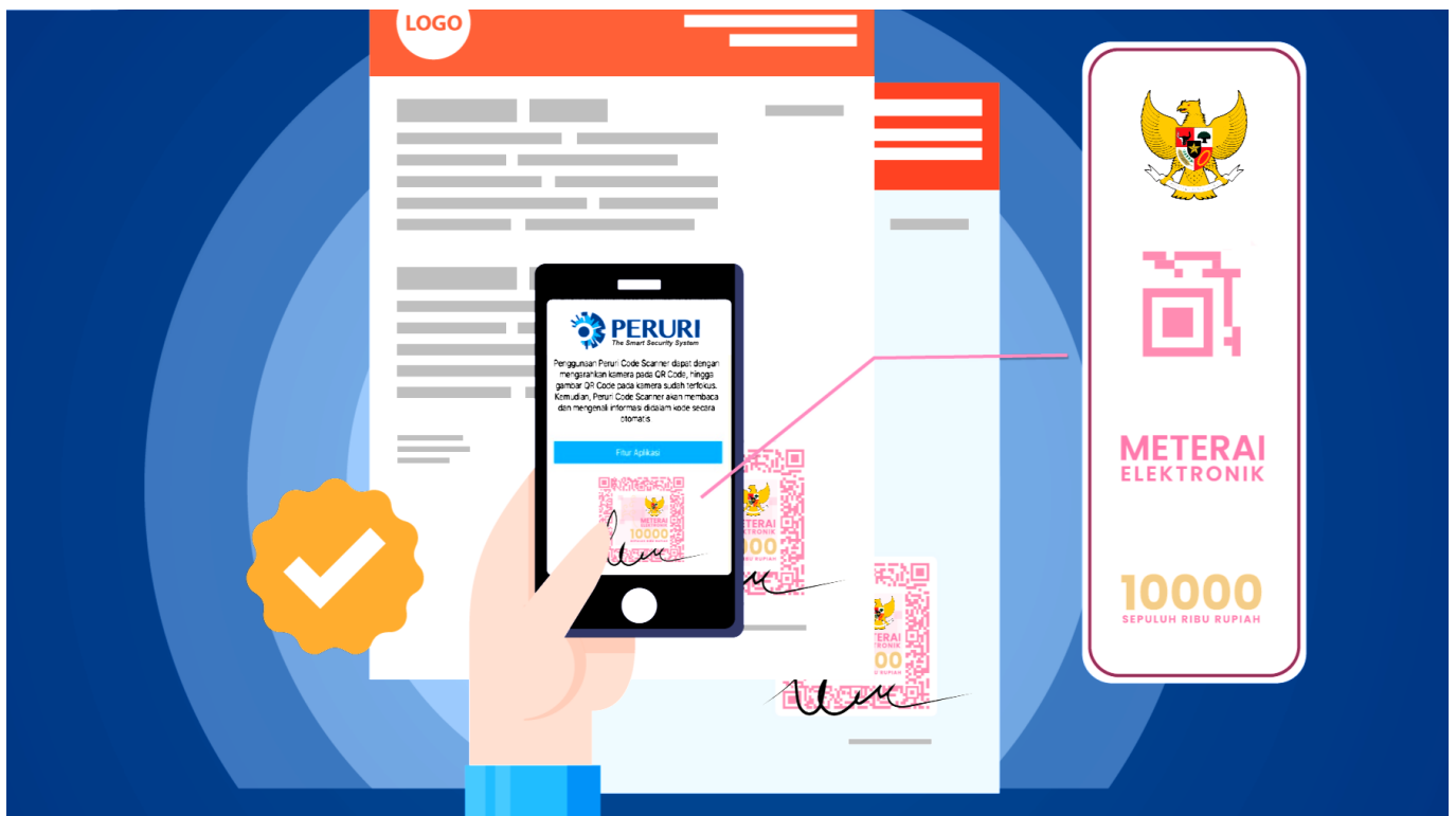
Cara cek keaslian meterai elektronik - mitracomm

Untuk memeriksa keaslian meterai elektronik, Anda dapat mengikuti langkah-langkah berikut: