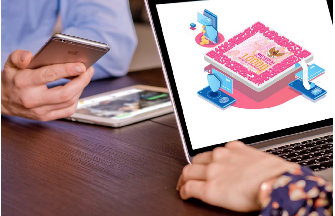
Ilustrasi menggunakan meterai elektroinik - istimewa