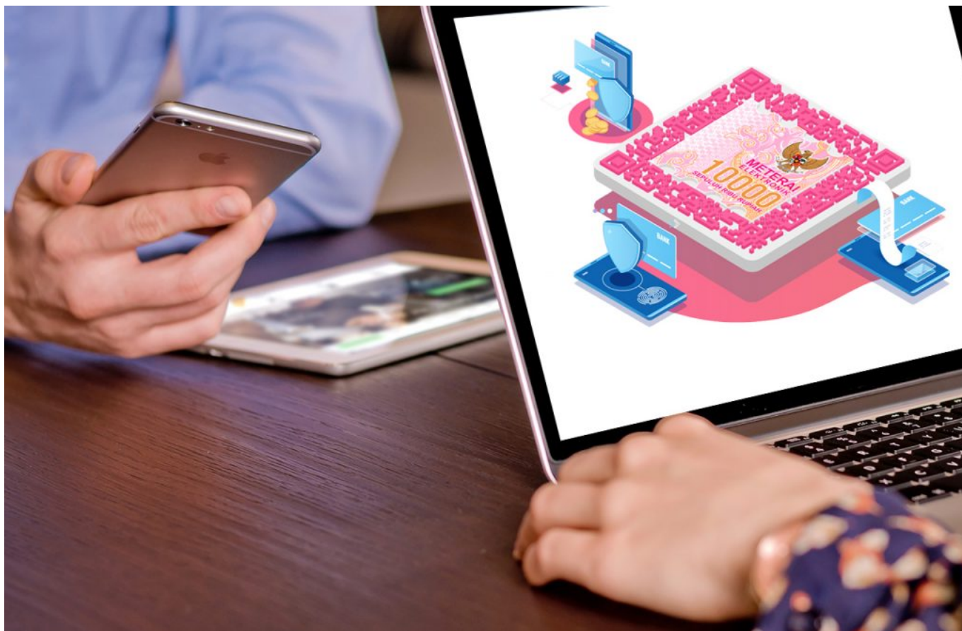
Ilustrasi menggunakan meterai elektronik - istimewa

Bagi yang membutuhkan meterai elektronik, berikut adalah langkah-langkah untuk membelinya: