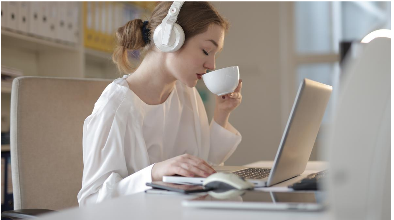
Ilustrasi wanita yang bekerja dengan santai

Siapa bilang bekerja lebih lambat berarti nggak produktif? Justru sebaliknya! Dengan