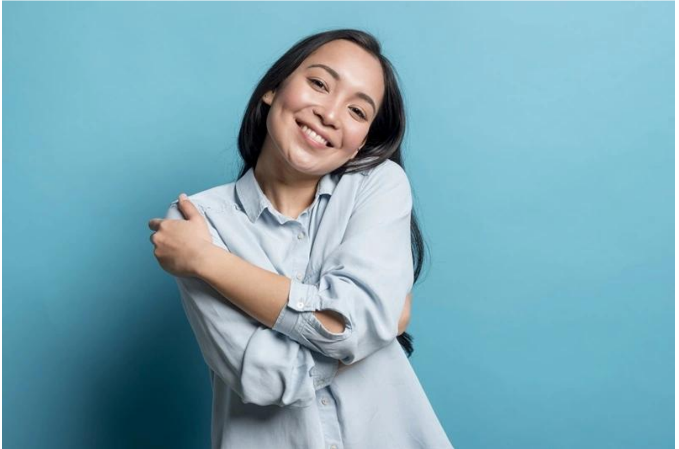
Ilustrasi self-love

Seringkali, kita terlalu keras kepala dalam mengendalikan semua hal dalam hidup. Padahal, ada banyak hal yang sebenarnya di luar kendali kita—seperti cuaca, respon orang lain, atau situasi tak terduga.