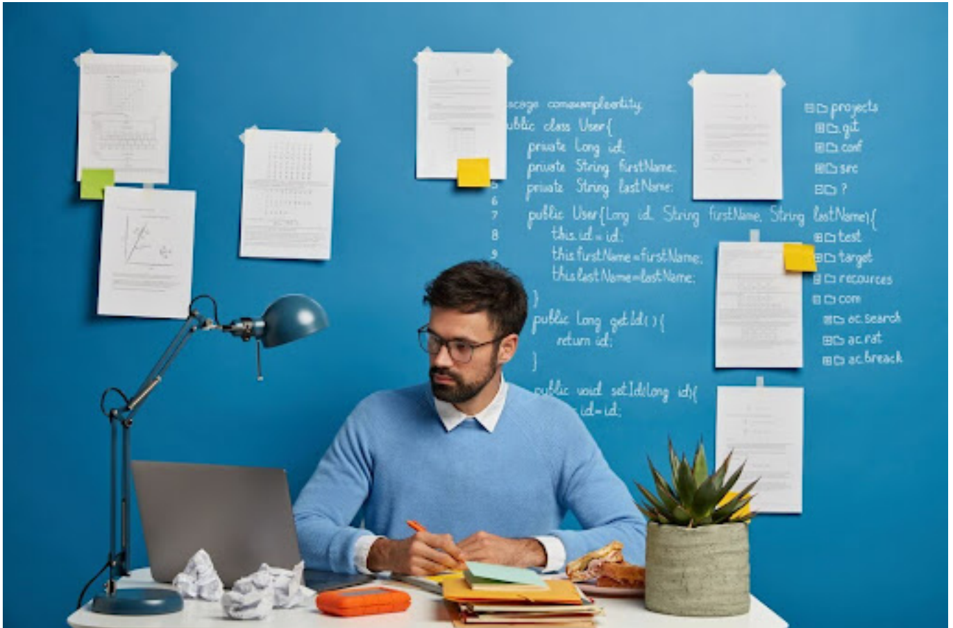
Ilustrasi pria yang fokus bekerja

Salah satu langkah pertama dalam menjalani hidup dengan take it slow adalah menetapkan prioritas. Kita sering terjebak dalam daftar tugas yang panjang banget, padahal nggak semuanya penting.