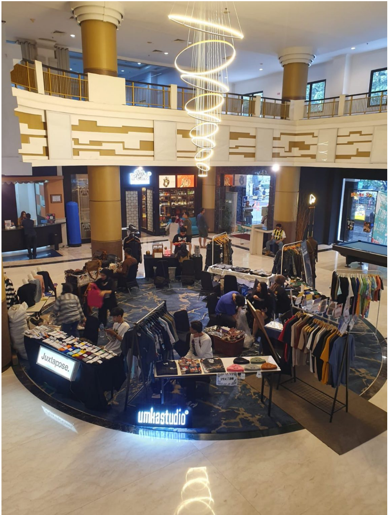
VUE PALACE, ARTOTEL CURATED – BANDUNG DUKUNG UMKM