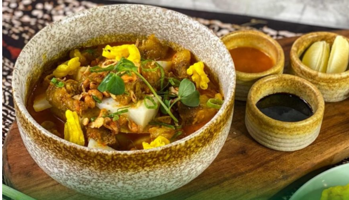
Doclang Pakuan IDR 30.000 NETT