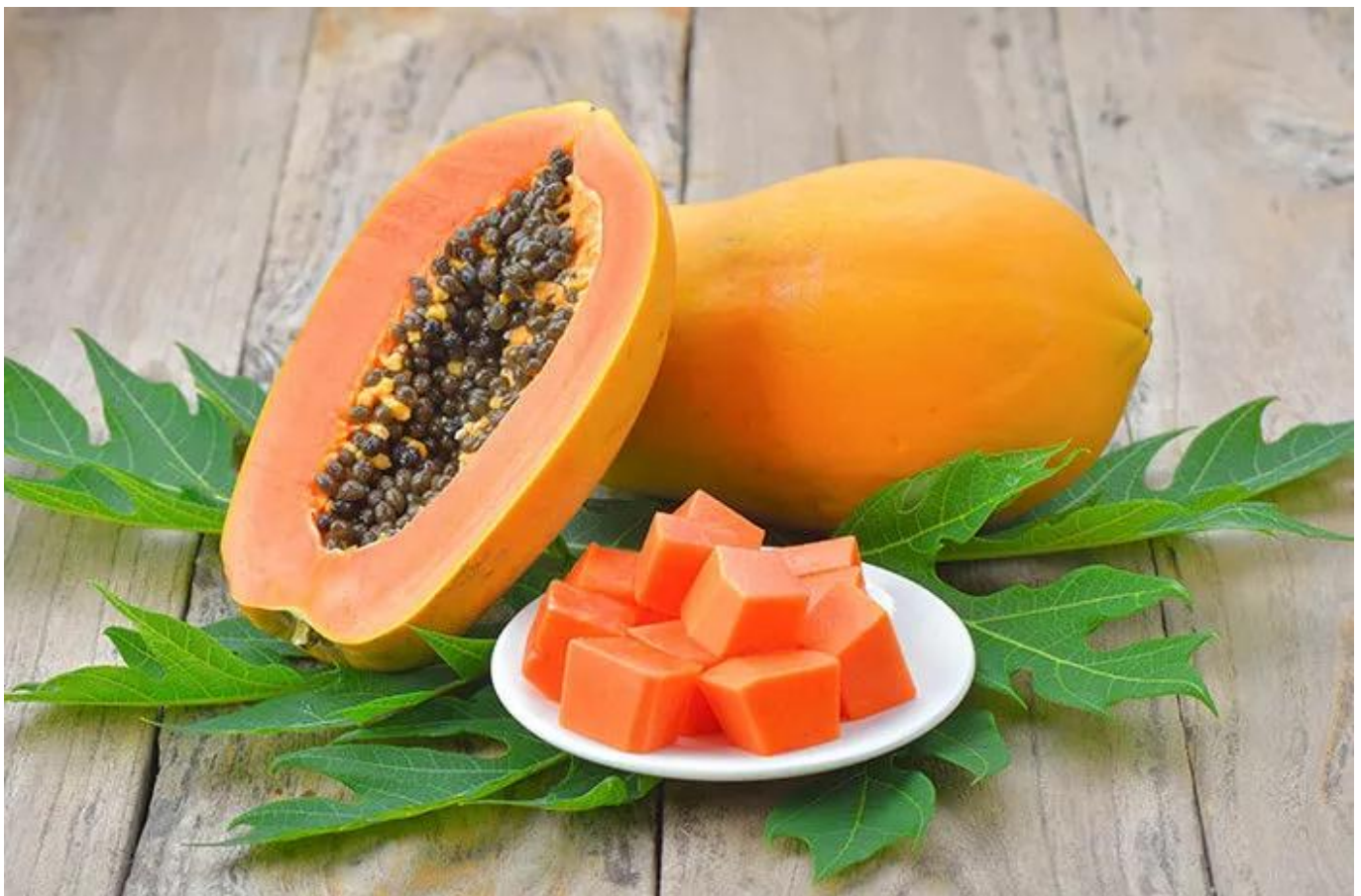
Buah pepaya - halodoc

Buah pepaya mengandung banyak nutrisi, di antaranya: