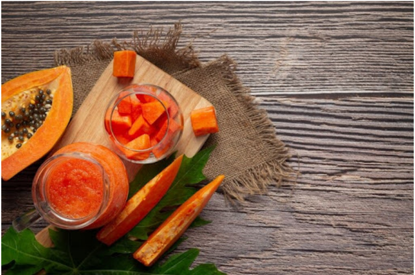
Olahan dari buah pepaya

Nah, sekarang udah tahu kan betapa banyaknya manfaat yang bisa kita dapat dari pepaya? Nggak cuma enak, tapi juga kaya nutrisi yang bikin tubuh makin sehat. Mulai dari pencernaan yang lancar sampai kulit yang glowing, semua bisa kamu dapatkan cuma dari makan pepaya.