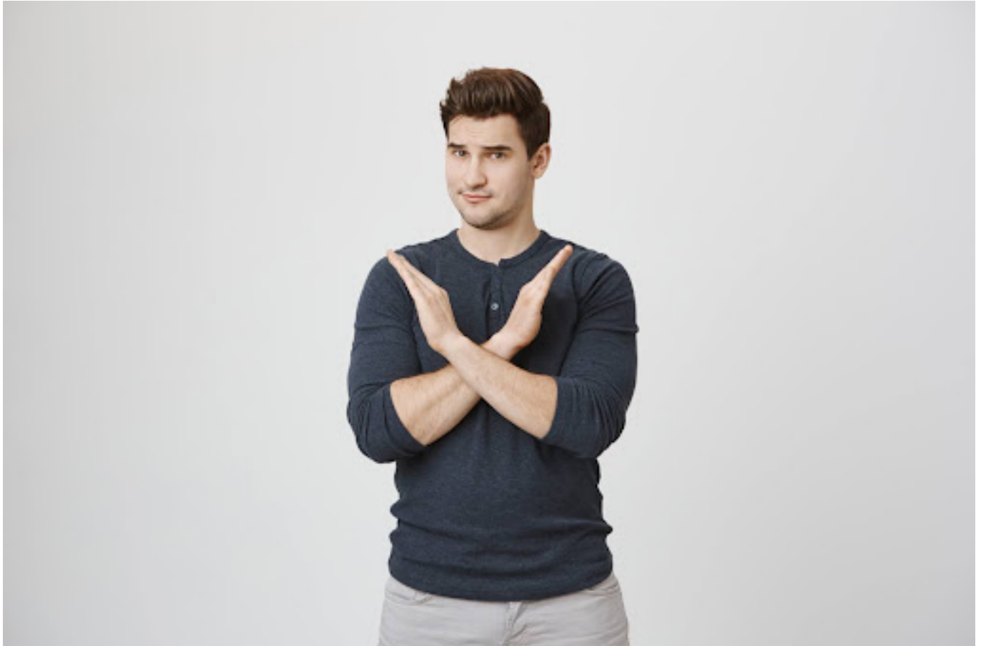
Ilustrasi pria yang menyilangkan tangan sebagai tanda menolak

Hentikan kebiasaan mengiyakan segala permintaan tanpa mempertimbangkan diri sendiri. Mengatakan tidak adalah hak yang perlu dihormati.