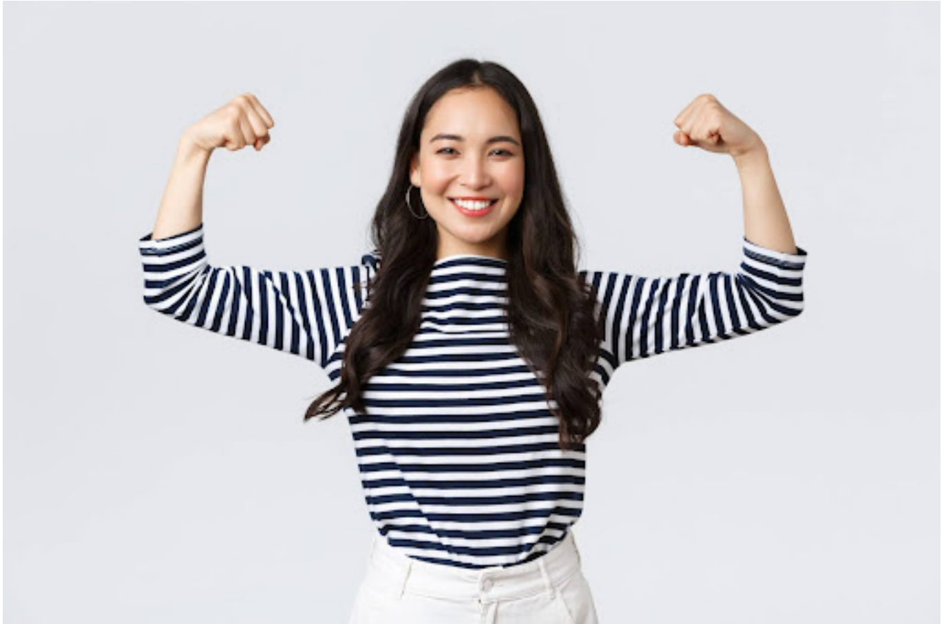
Ilustrasi wanita yang tersenyum dan menunjukkan ketangguhannya

Tingkatkan rasa percaya diri untuk mengatasi kebutuhan akan persetujuan dari orang lain. Hal ini dapat membantu melawan keinginan untuk selalu menyenangkan orang lain.