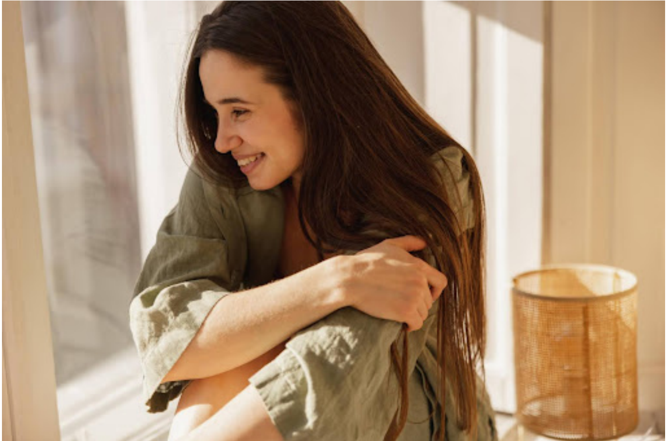
Ilustrasi wanita yang sedang duduk tersenyum

Tanamkan kebiasaan untuk mengutamakan kebutuhan dan keinginan pribadi. Ini bukan tanda egoisme, melainkan kepedulian terhadap kesejahteraan diri.