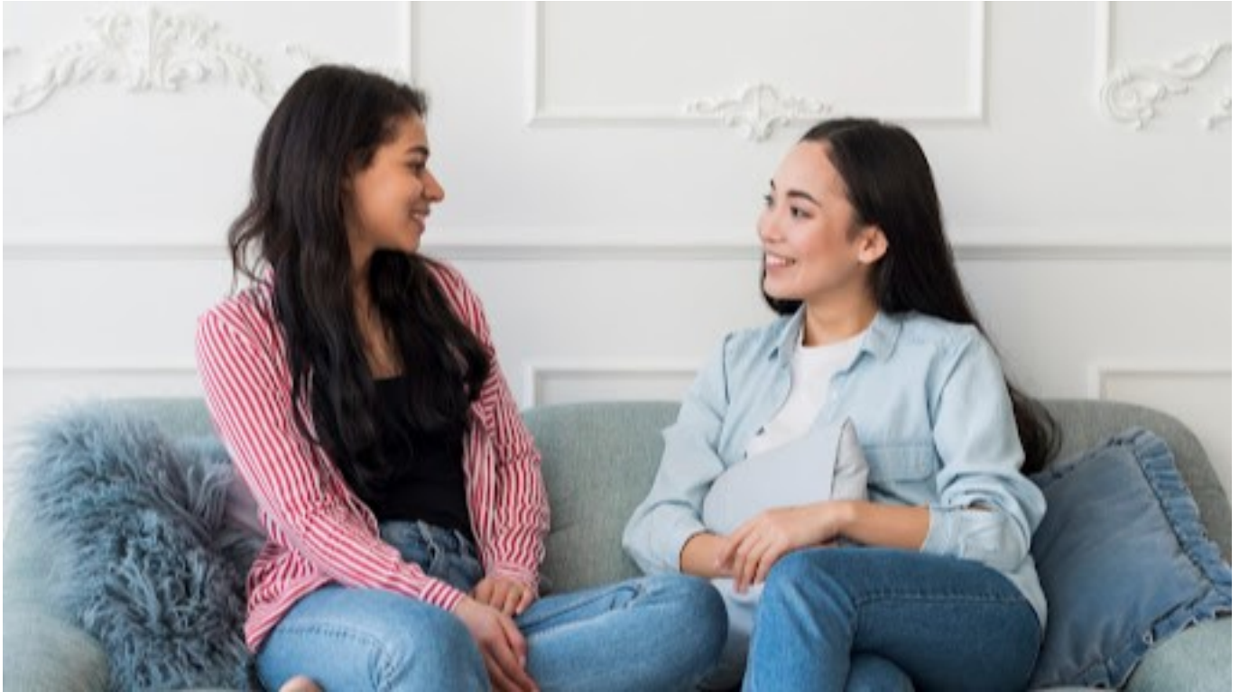
ilustrasi dua wanita sedang mengobrol di sofa

Berbicaralah secara terbuka dengan orang-orang di sekitar kita. Jelaskan batasan dan harapan kita, sehingga tidak terjebak dalam memenuhi ekspektasi yang tidak realistis.