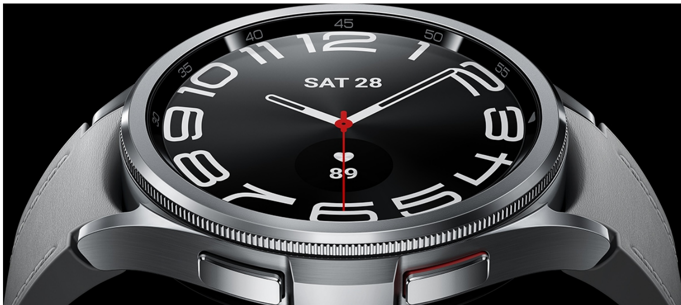
Spesifikasi Samsung Galaxy Watch 6 Classic - samsung

Jeroannya didukung oleh chipset Exynos W930 (5 nm) dengan CPU Dual-core 1.4 GHz Cortex-A55 dan GPU Mali-G68. Plus, RAM 2 GB dan media penyimpanan internal sebesar 12 GB. Ini semua bikin kinerjanya terasa cepat dan halus.