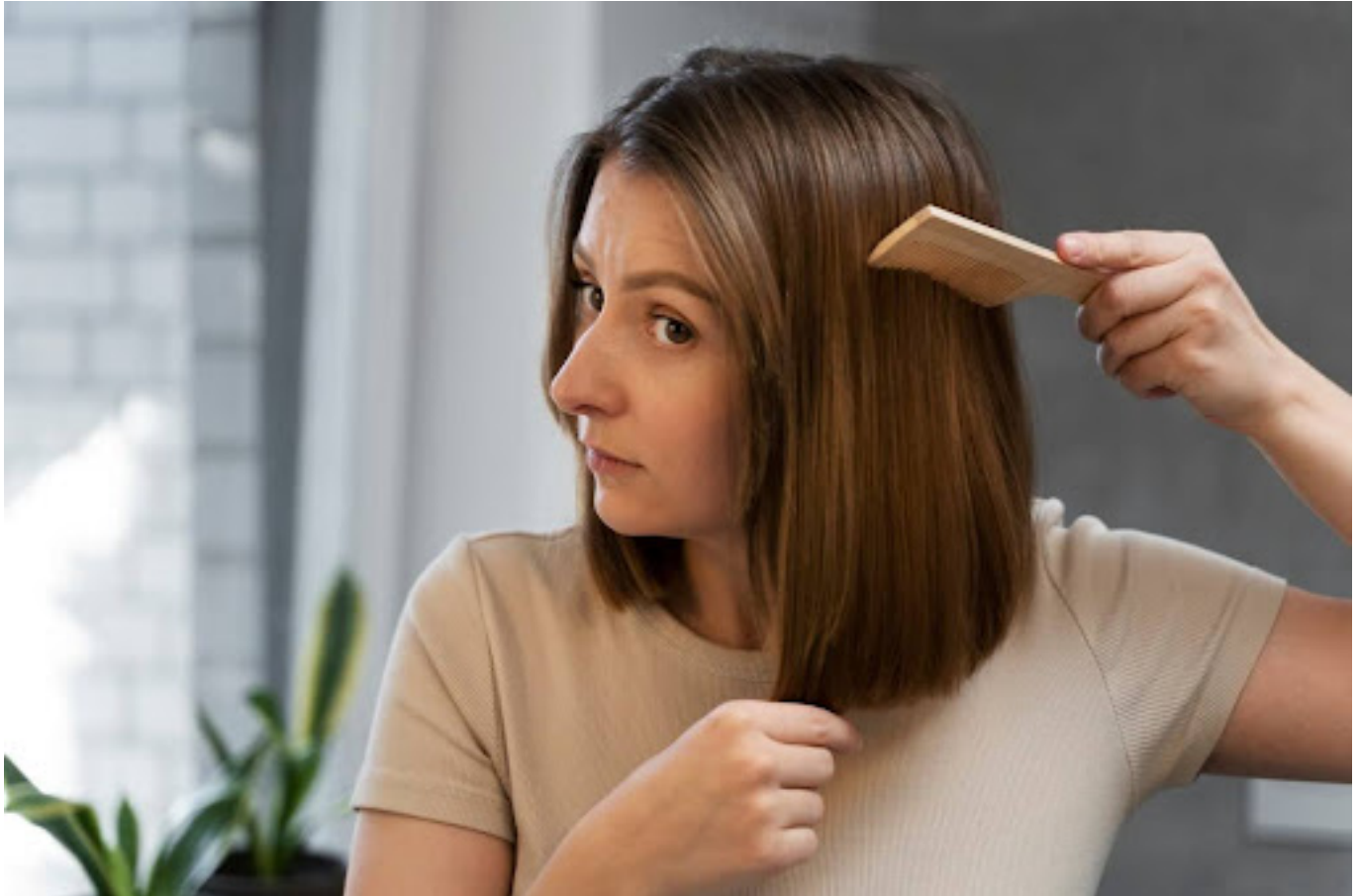
ilustrasi wanita yang melakukan perawatan rambut

Stres dapat memperburuk masalah ini. Lakukan kegiatan yang dapat membantu meredakan stres, seperti yoga, meditasi, menonton kartun atau mendengarkan musik.