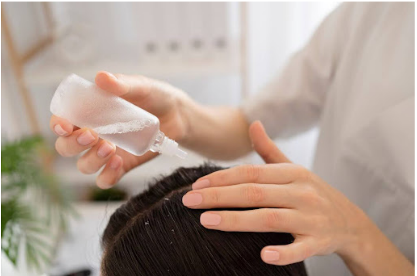
ilustrasi perawatan rambut - Freepik