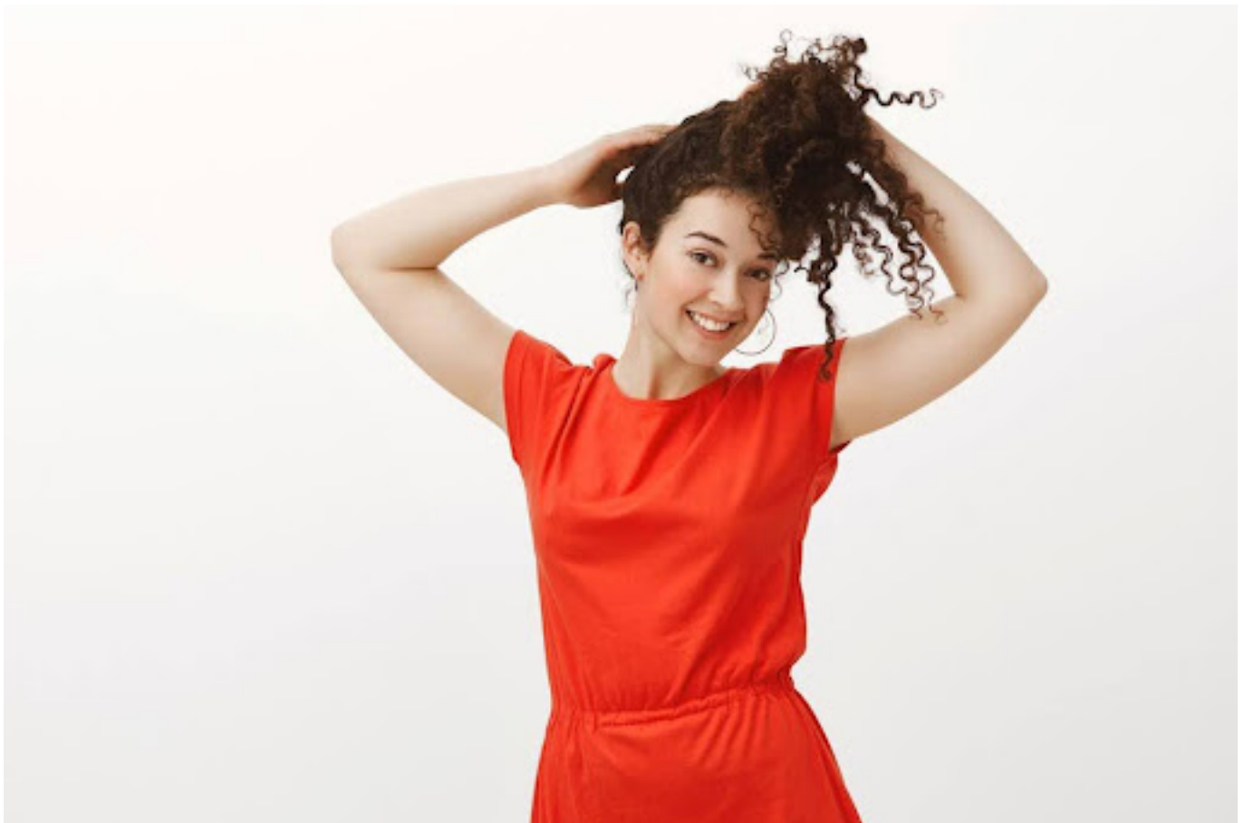
ilustrasi wanita dengan rambut yang sehat dan indah

Si kecil putih ini memang menyebalkan karena sangat mengganggu, tapi bukan berarti kamu