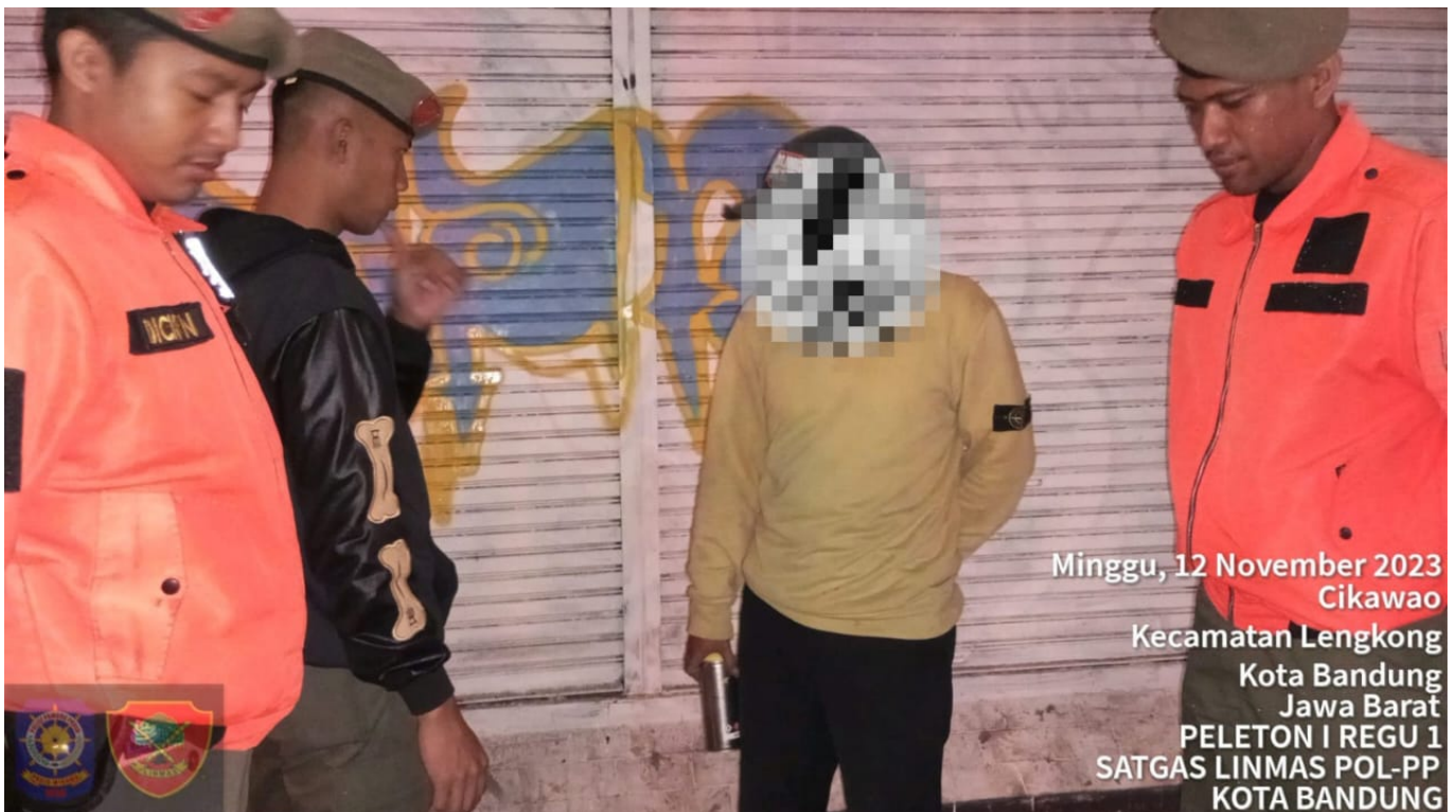
Pelaku vandalisme saat di tangkap oleh Satpol PP Kota Bandung

MF melakukan aksi tersebut di Jalan Asia Afrika – Tambong. Sebelumnya, ia sudah pernah melakukan vandalisme di Jalan ABC.