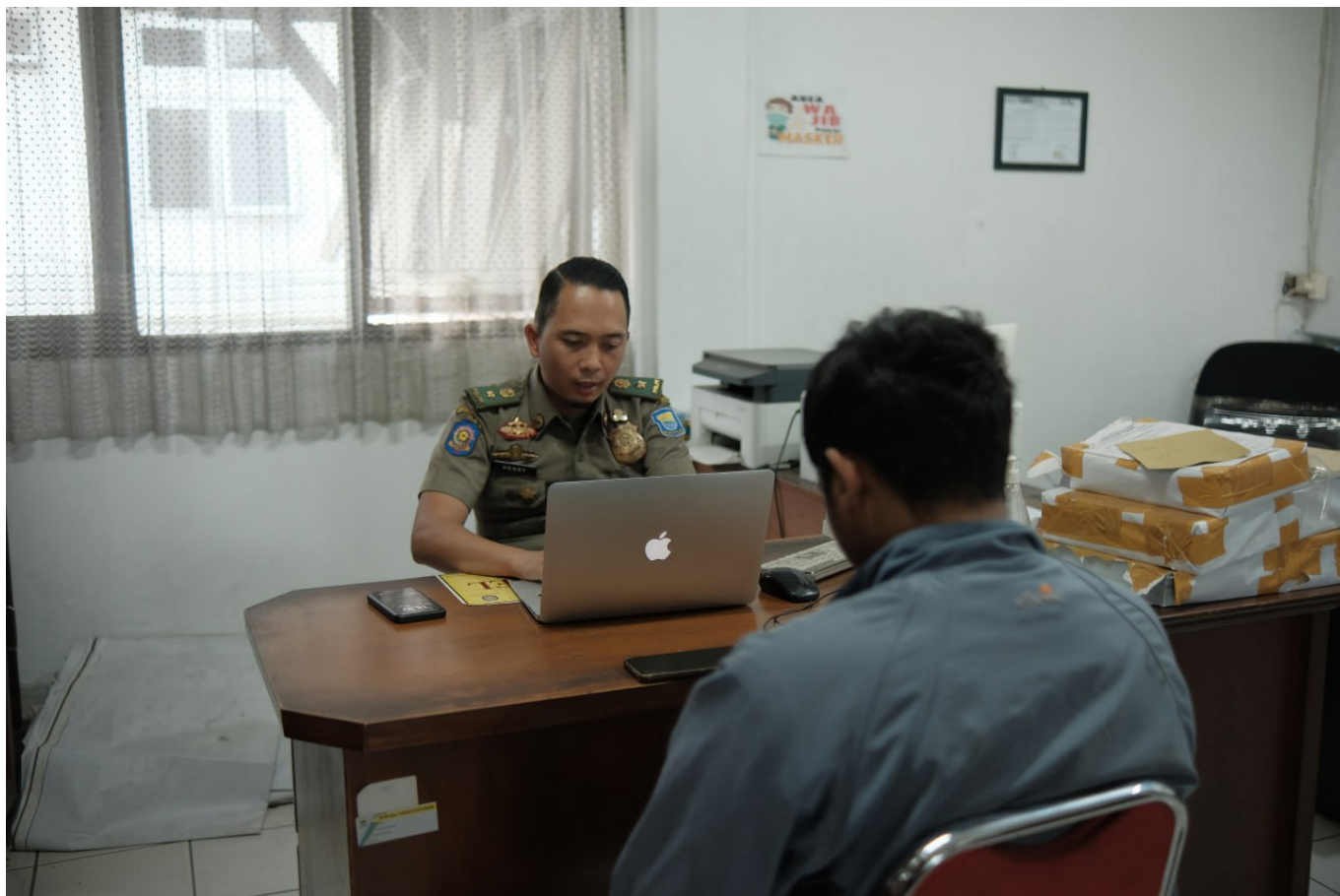
Pelaku vandalisme saat dimintai keterangan - istimewa

Atas perbuatannya, MF melanggar Peraturan Daerah Nomor 9 tahun 2019 tentang Ketertiban Umum, Ketentraman dan Perlindungan Masyarakat.