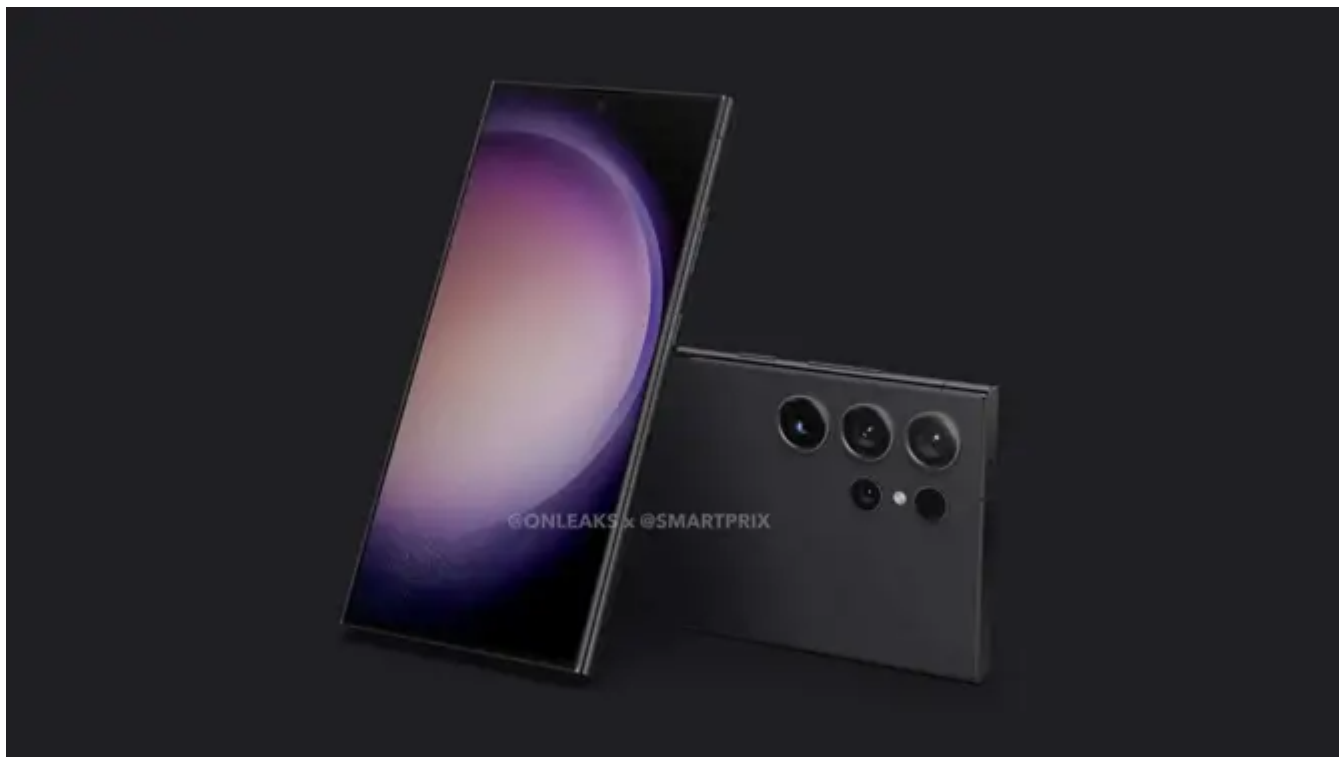
Overview Samsung Galaxy S24 - Onleaks

Daftar Geekbench mengindikasikan bahwa perangkat ini akan dilengkapi dengan chip Exynos 2400 yang baru saja diperkenalkan oleh Samsung.