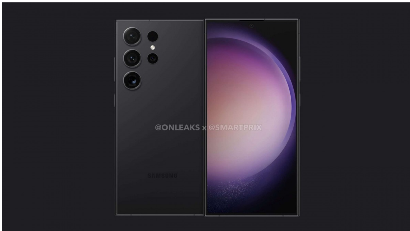
Tampilan Samsung Galaxy S24

Demi perbandingan, Galaxy S23 saat ini memiliki skor rata-rata 1.881 untuk single-core dan 4.985 untuk multi-core. Namun, ini masih di bawah iPhone 15 dengan skor 2559 untuk single-core dan 6375 untuk multi-core.