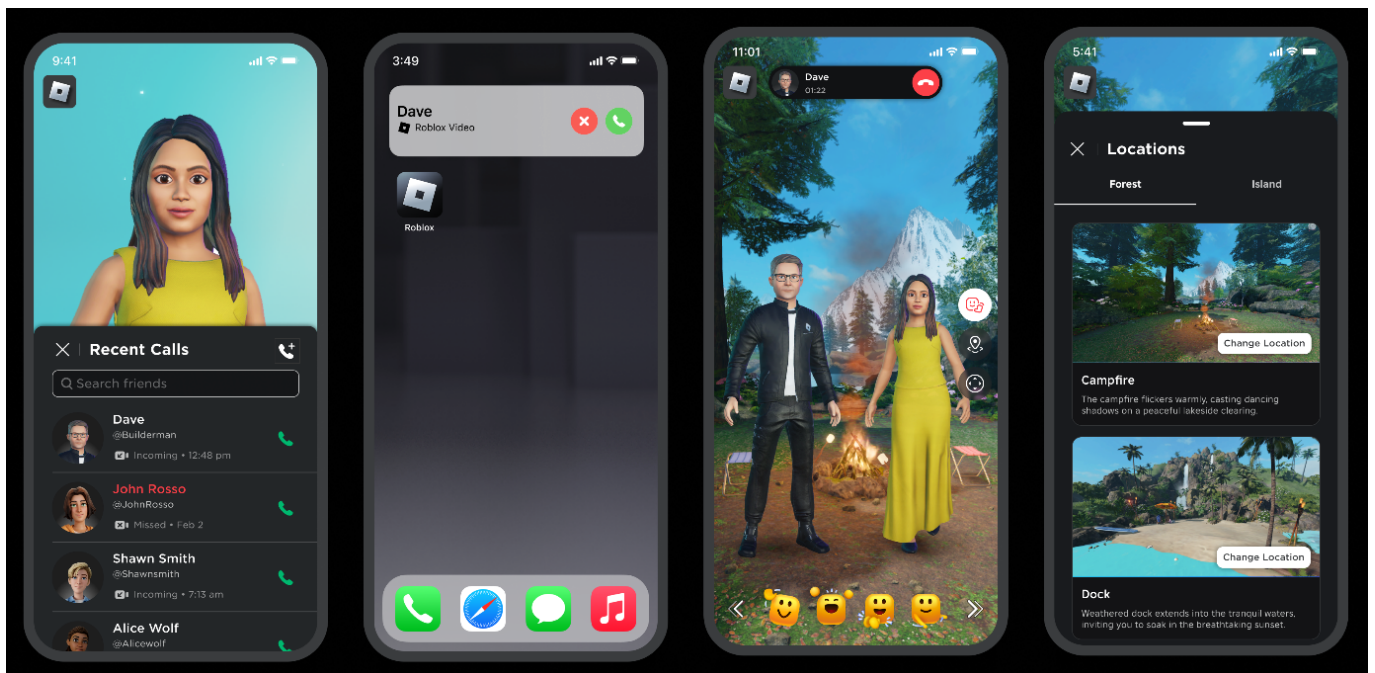
Tampilan UI Aplikasi bila ada teman melakukan video call

Salah satu fitur yang paling menarik adalah Roblox Connect, yang memungkinkan pemain untuk terhubung satu sama lain secara real-time melalui video call .