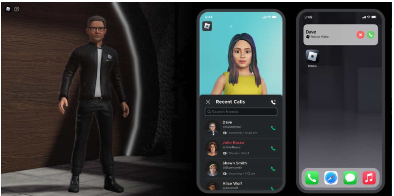
Fitur Terbaru untuk Berkomunikasi dengan teman dengan avatarnya

Perusahaan berkomitmen untuk menjadi platform yang inklusif dan aman bagi semua orang. Mereka akan terus berinvestasi dalam fitur-fitur yang membuat platformnya lebih aman dan menarik bagi semua pemain.