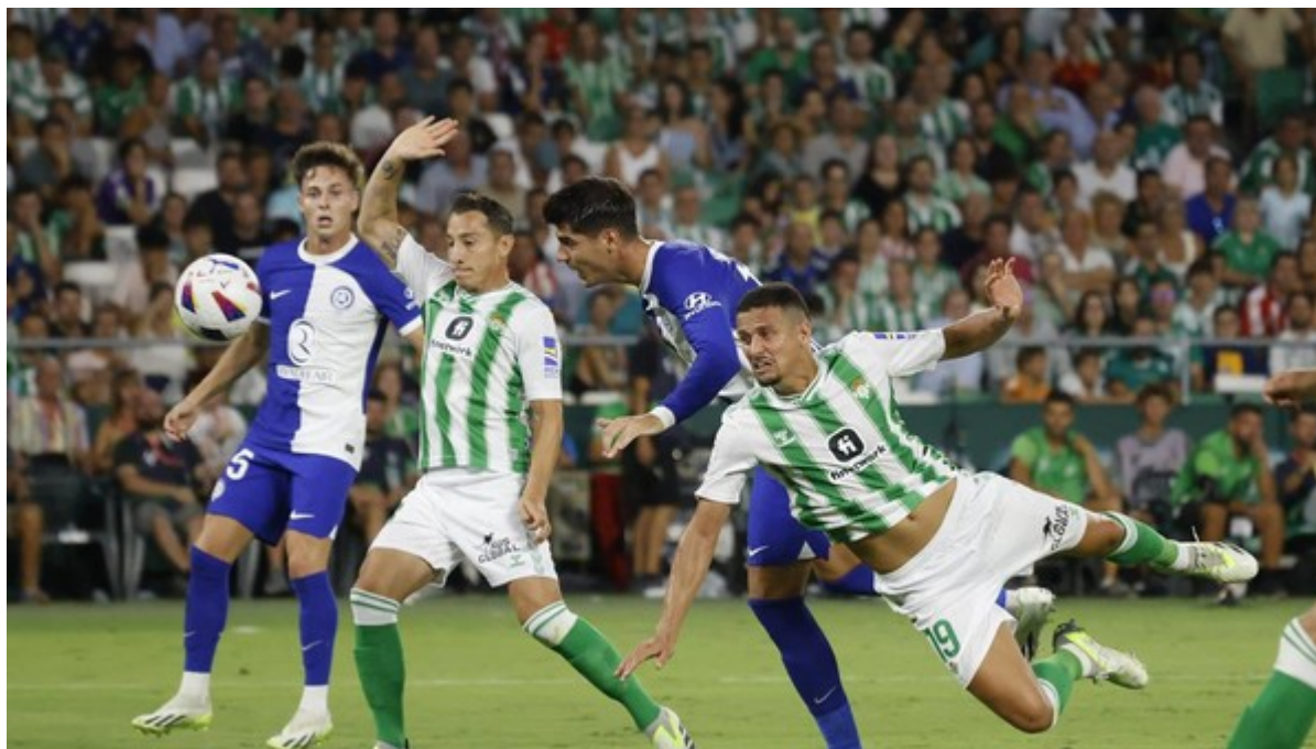
Real Betis vs Atletico Madrid

Pada pertandingan tersebut, Real Betis mencatatkan total 14 tembakan, dengan distribusi pemain sebagai berikut: