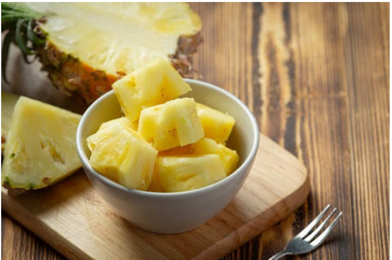
Ilustrasi nanas yang dipotong

Dalam buah nanas, terdapat sejumlah nutrisi yang mengesankan, termasuk air, protein, lemak, serat, kalsium, fosfor, zat besi, natrium, kalium, tembaga, seng, beta-karoten, karoten