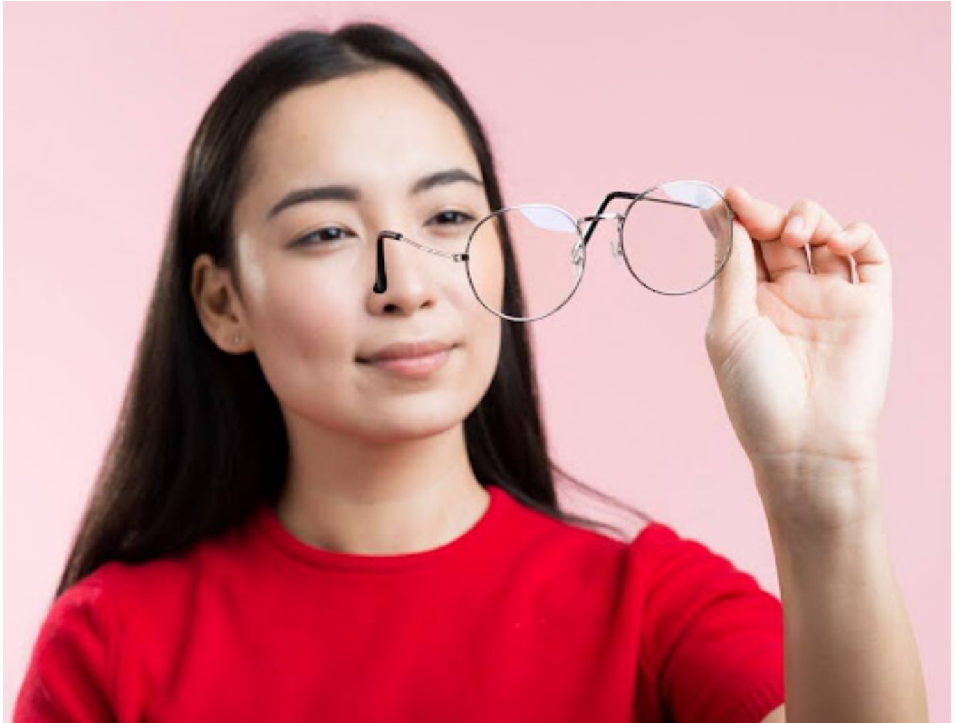
Rabun Jauh vs Rabun Dekat : ilustrasi wanita yang melihat kaca mata

Baik rabun jauh maupun rabun dekat dapat menimbulkan gejala seperti sakit kepala, mata lelah, dan ketegangan mata. Namun, penyebabnya antara Rabun Jauh vs Rabun Dekat berbeda: