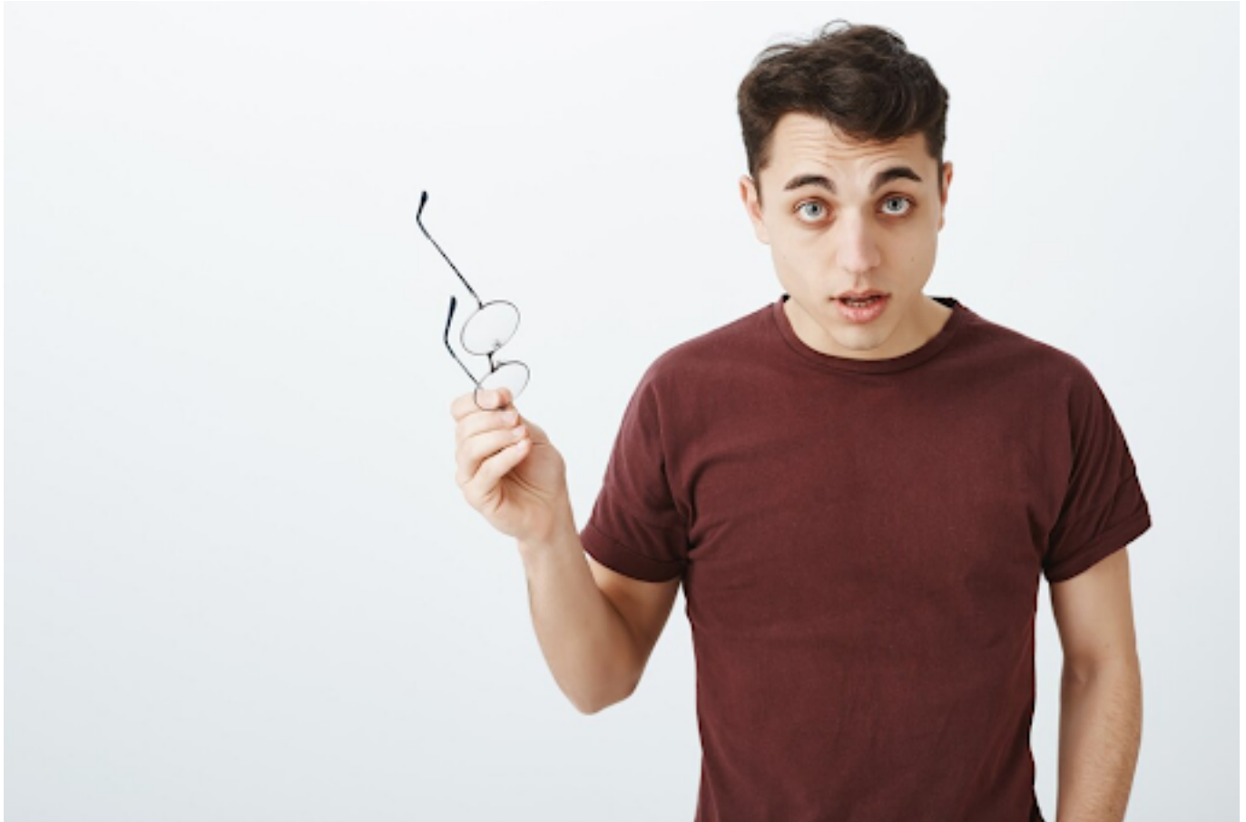
ilustrasi pria yang melepas kacamata

Berikut beberapa gejala yang perlu kamu waspadai: