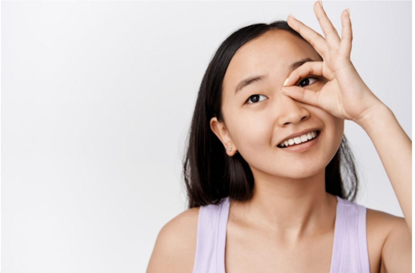
ilustrasi mata yang sehat

Rabun dekat tidak boleh dibiarkan, karena dapat mengganggu aktivitas sehari-hari dan meningkatkan risiko penyakit mata lainnya.