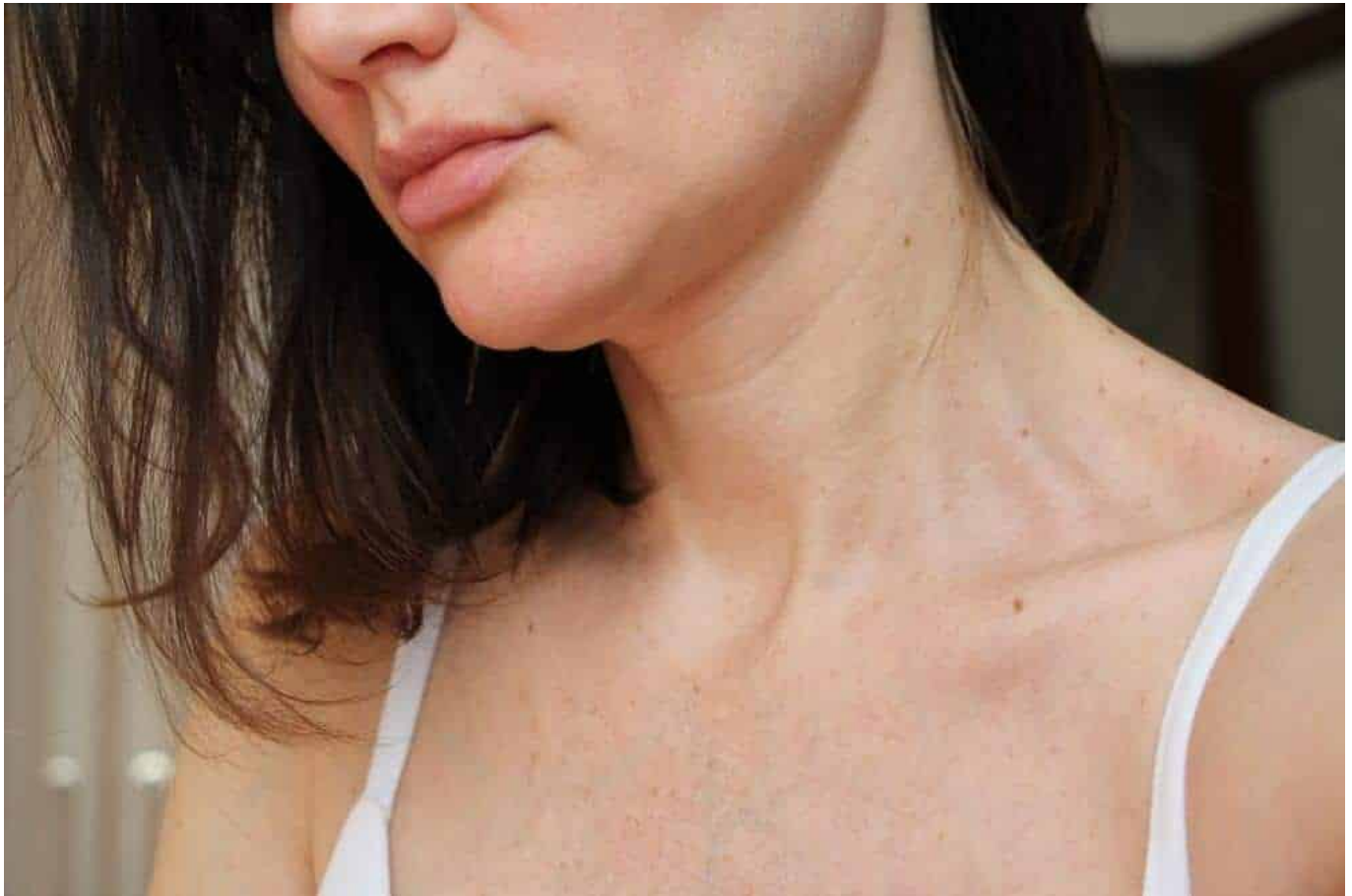
Ilustrasi Leher Bergaris - Ist