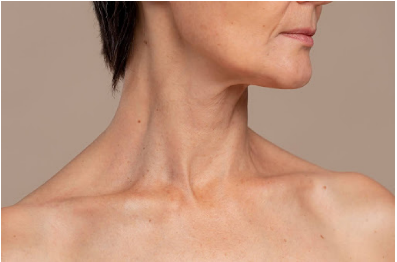
Ilustrasi leher bergaris - freepik

Munculnya garis-garis pada leher merupakan proses alami yang dipengaruhi oleh berbagai faktor, baik internal maupun eksternal. Berikut adalah beberapa penyebab utama: