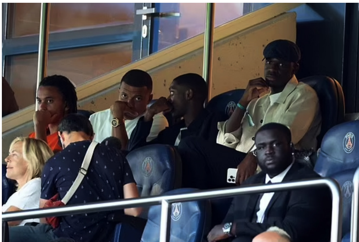
Kylian Mbappe ada di tribun pasa saat pertandingan PSG vs Lorient berlangsung

Baca Juga: Pemkot Bandung Siapkan Pengamanan Ketat untuk Pawai Persib 25 Mei