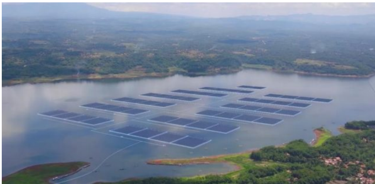
Pemandangan Proyek PLTS Terapung di Waduk Cirata dari ketinggian

Baca Juga:Fraksi PSI Soroti Pengelolaan Sampah dan Transparansi Anggaran dalam Pembahasan Tiga Raperda Kota Bandung