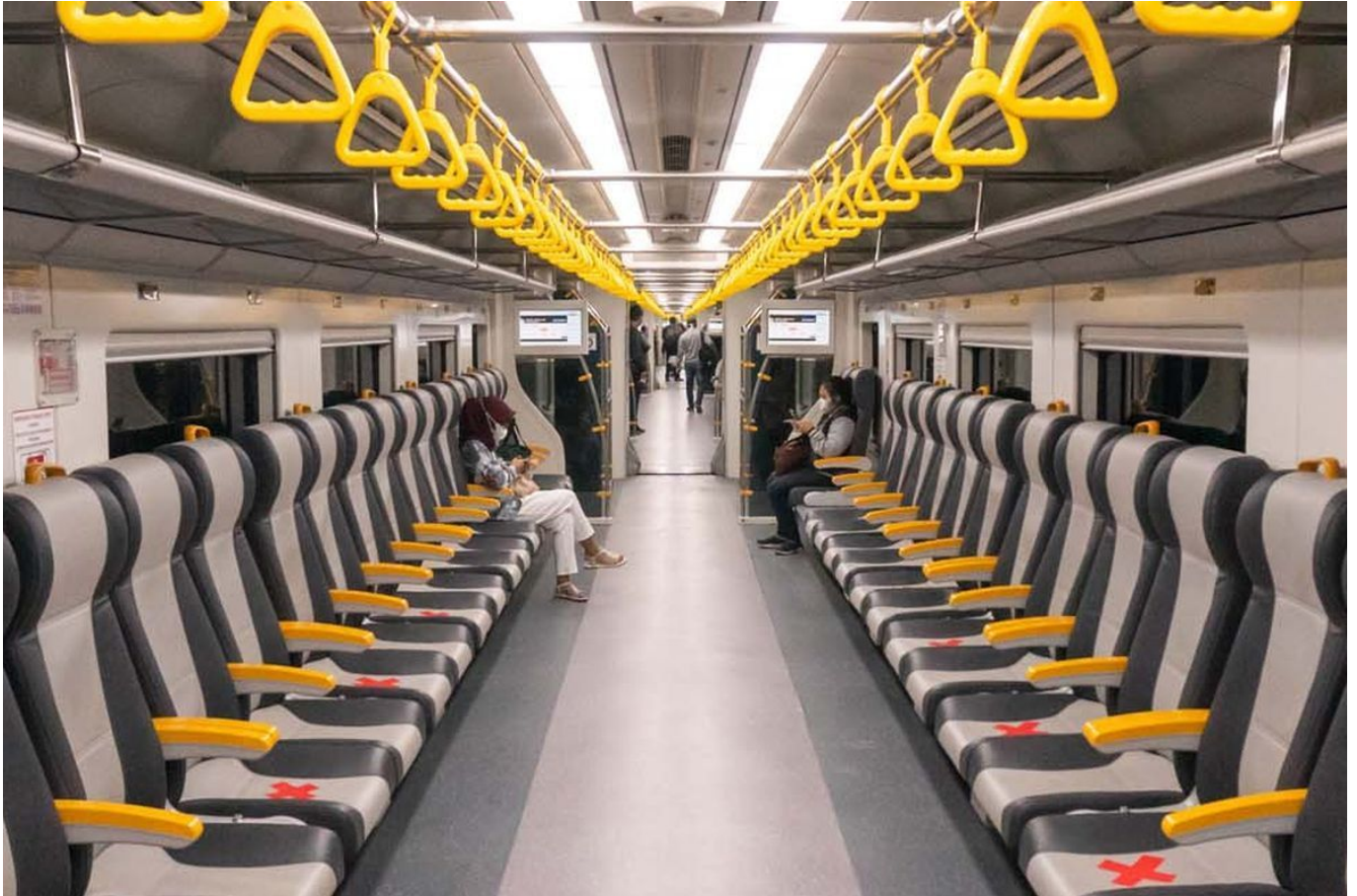
KRL Bandara Soetta

Gampang banget! Kamu bisa beli tiket promo ini mulai H-7 sebelum jadwal keberangkatan. Bisa lewat aplikasi pemesanan tiket online atau langsung dari vending machine yang ada di stasiun.