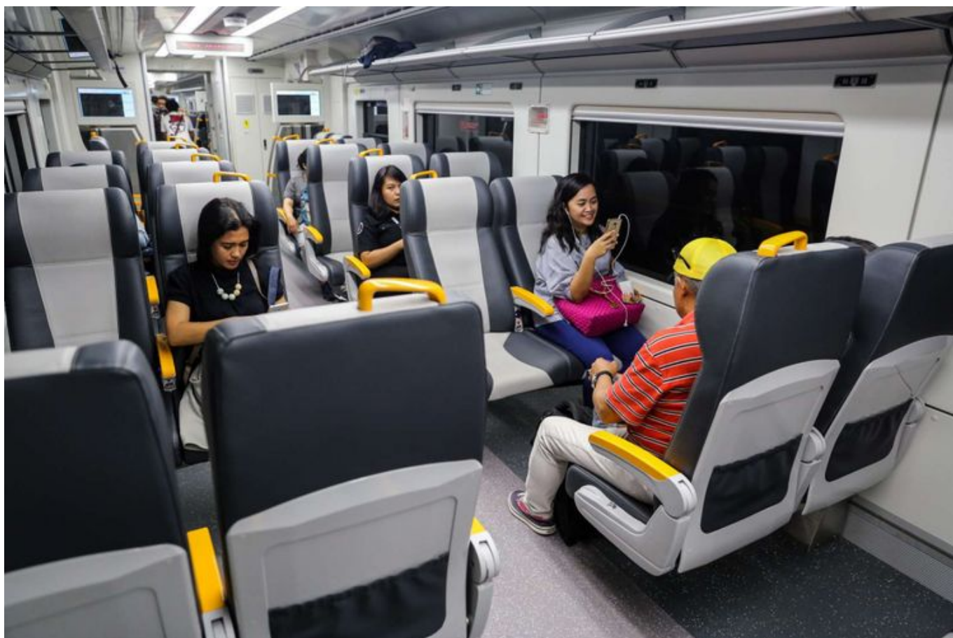
KRL Bandara Soetta

Promo Merdeka ini merupakan bentuk komitmen KAI Commuter untuk terus meningkatkan pelayanan kepada pengguna. Jadi, tunggu apa lagi?