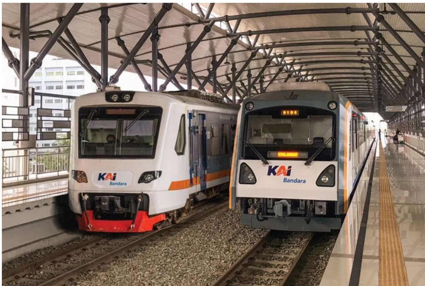
KRL Bandara Soetta

Baca Juga:3 Gerbong KA Bangun Karta Anjlok di Bumiayu