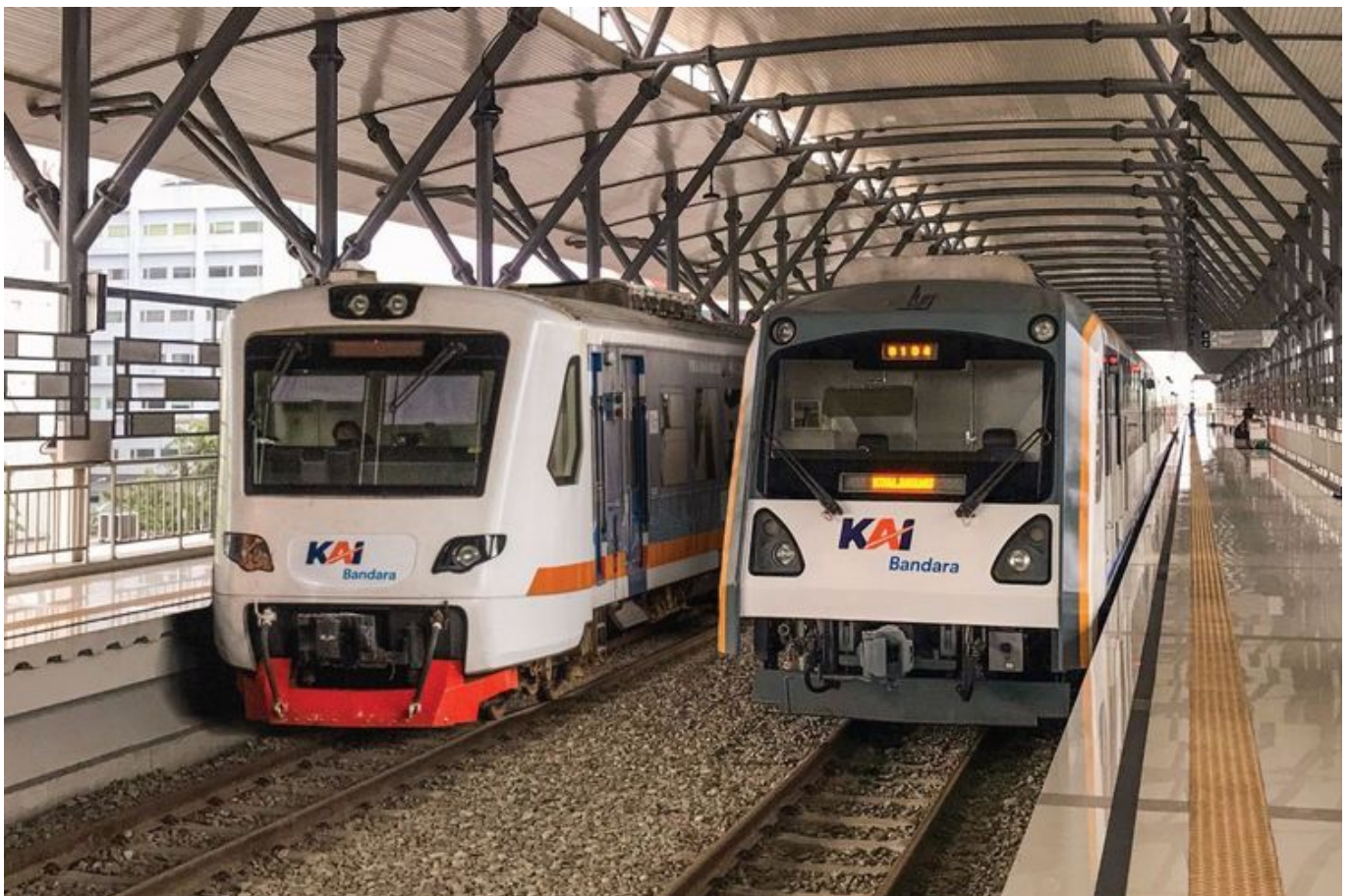
KRL Bandara Soetta

Baca Juga:3 Gerbong KA Bangun Karta Anjlok di Bumiayu