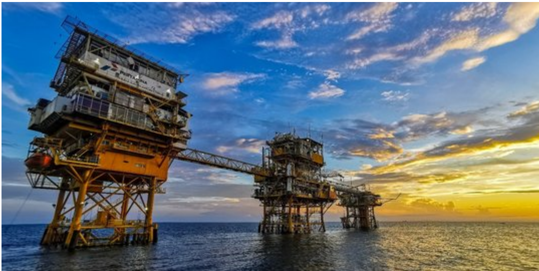
Ilustrasi Migas – istimewa

Pada hari itu, minyak mentah Brent sempat menyentuh angka USD89 per barel sebelum stabil di harga USD87,27.