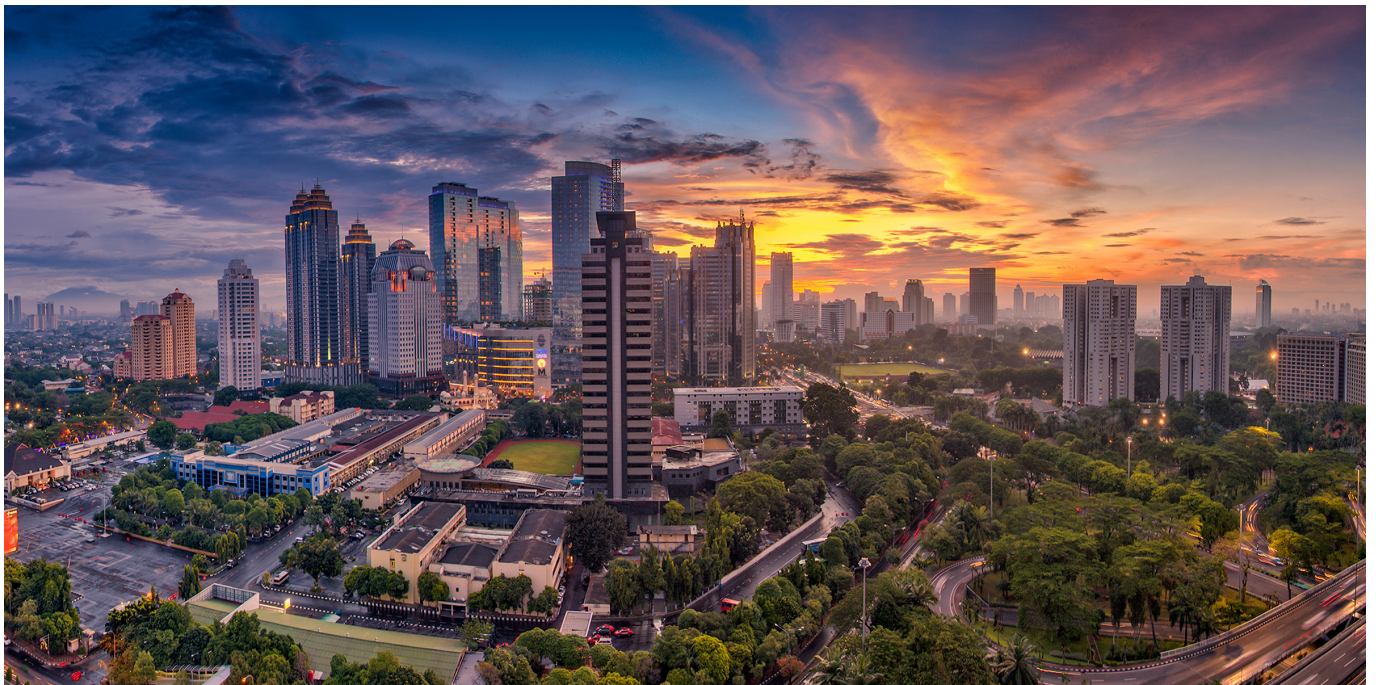
Kota Jakarta