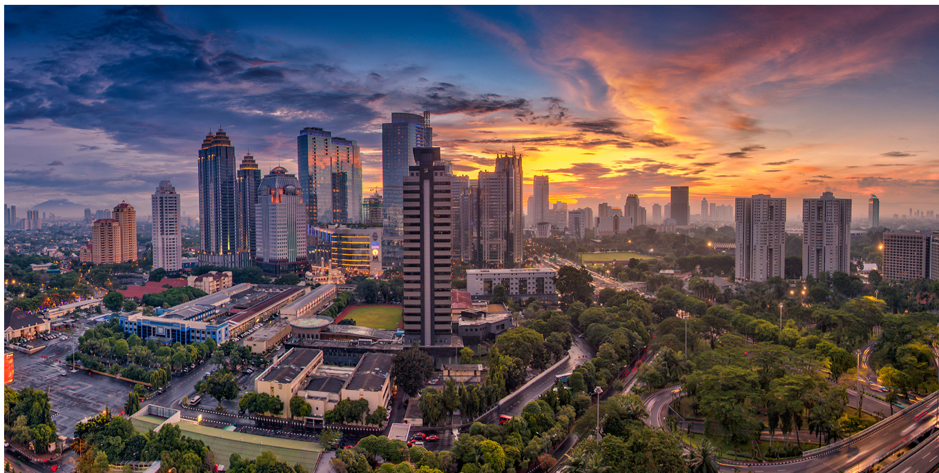
Kota Jakarta - 12go.asia