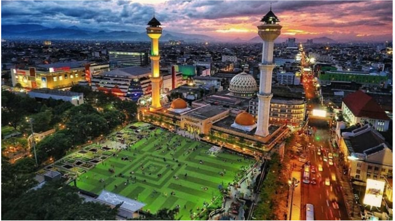
Kota Bandung – pikniek.com