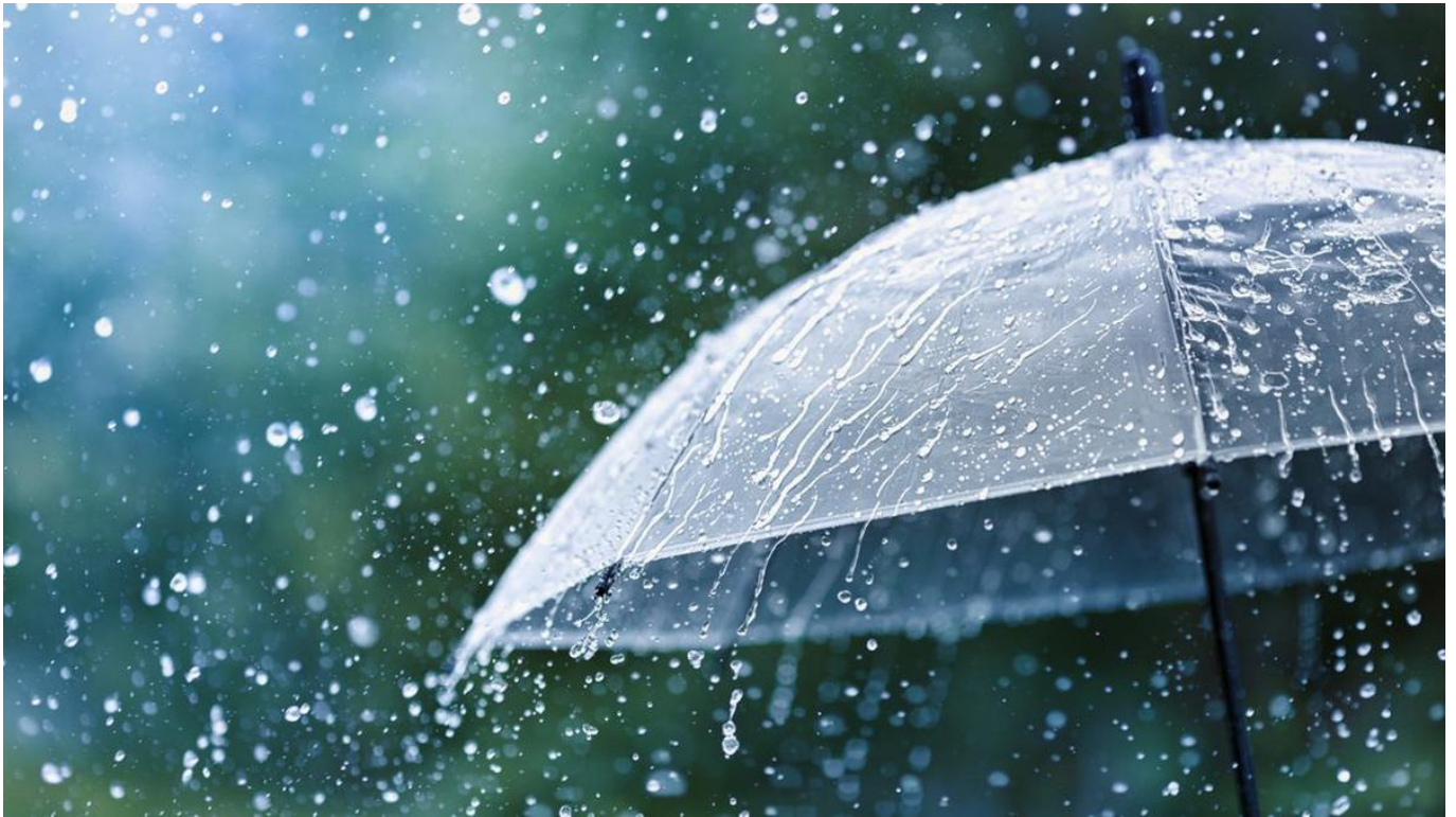
Ilustrasi hujan

JAKARTA, Prolite – BMKG telah merilis prakiraan cuaca untuk sebagian wilayah di Ibu Kota DKI Jakarta pada hari ini, Selasa (10/10/2023). Berdasarkan informasi yang diperoleh dari situs web resmi BMKG, berikut adalah rangkuman prakiraan cuaca: