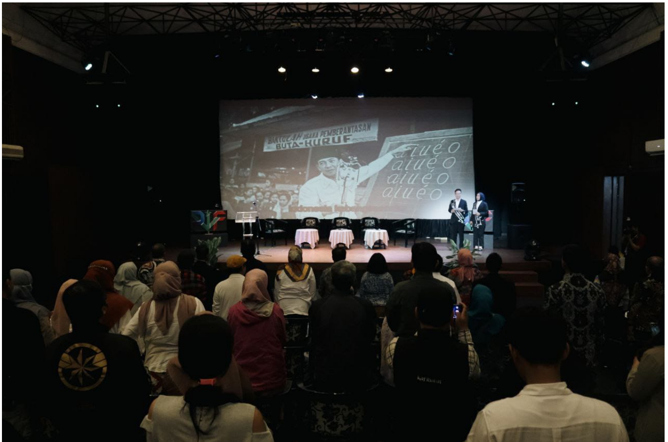
Salah satu kegiatan di PWF – Humas Kota Bandung