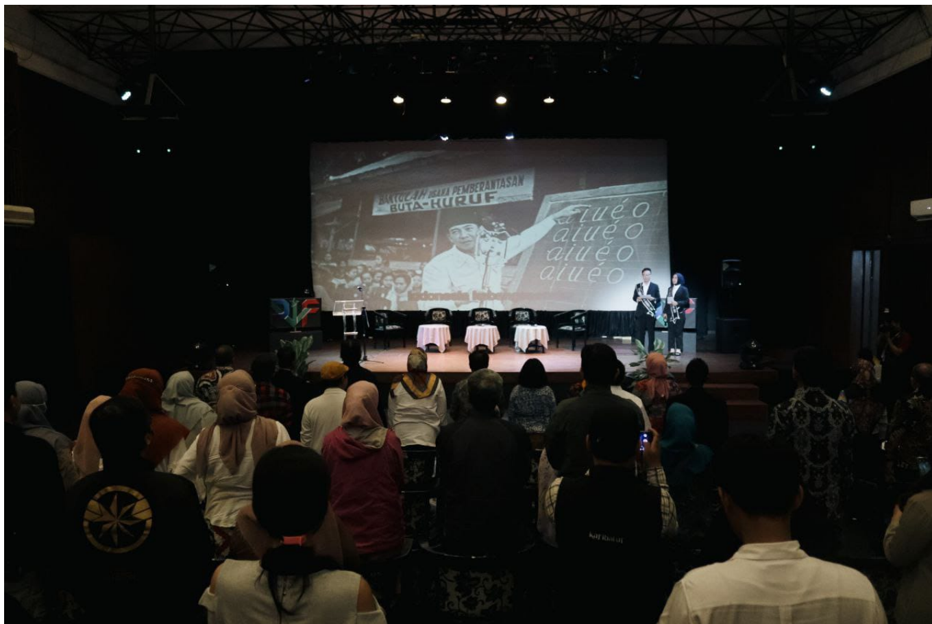
Salah satu kegiatan di PWF – Humas Kota Bandung