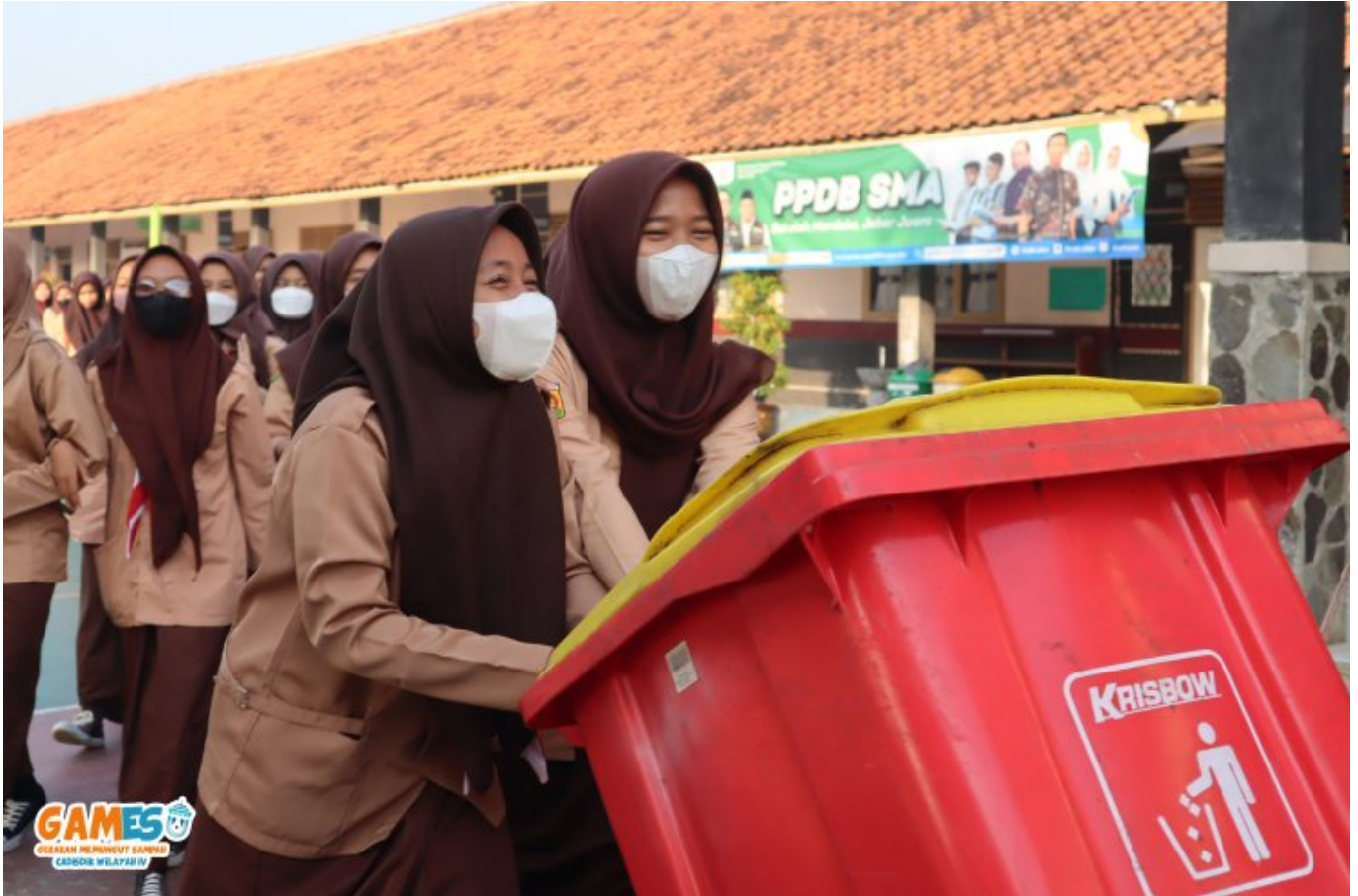
Disdik Jawa Barat

ia berharap, secara perlahan permasalahan sampah mampu dilakukan di setiap sekolah. Sehingga mampu mengurangi produksi sampah yang saat ini masih dalam kondisi darurat.