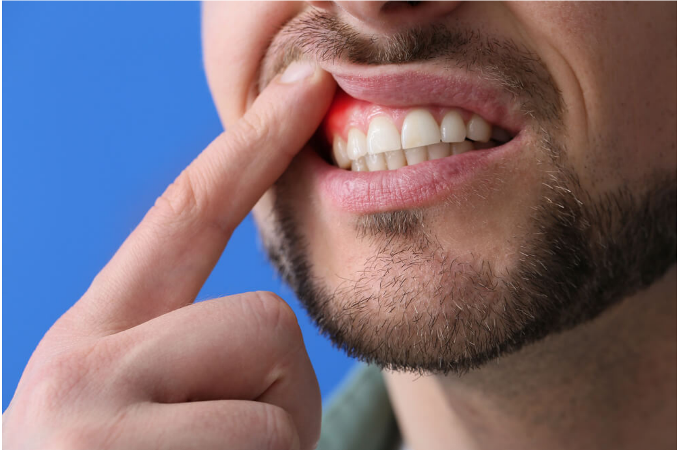
Gum Disease Gingivitis and Periodontitis

Nggak semua orang punya risiko yang sama. Beberapa faktor yang bisa bikin kamu lebih rentan kena penyakit gusi: