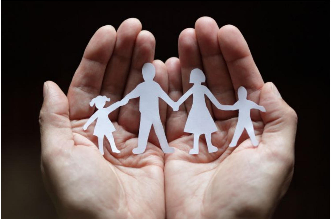
Ilustrasi keluarga berencana

Di Indonesia, Hari Kontrasepsi Sedunia diberi penghargaan oleh berbagai organisasi kesehatan dan keluarga berencana. Mereka biasanya menyelenggarakan berbagai kegiatan, seperti seminar, diskusi, dan kampanye pendidikan.