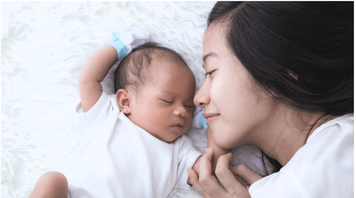
Ibu dan bayinya - johnsonsbaby