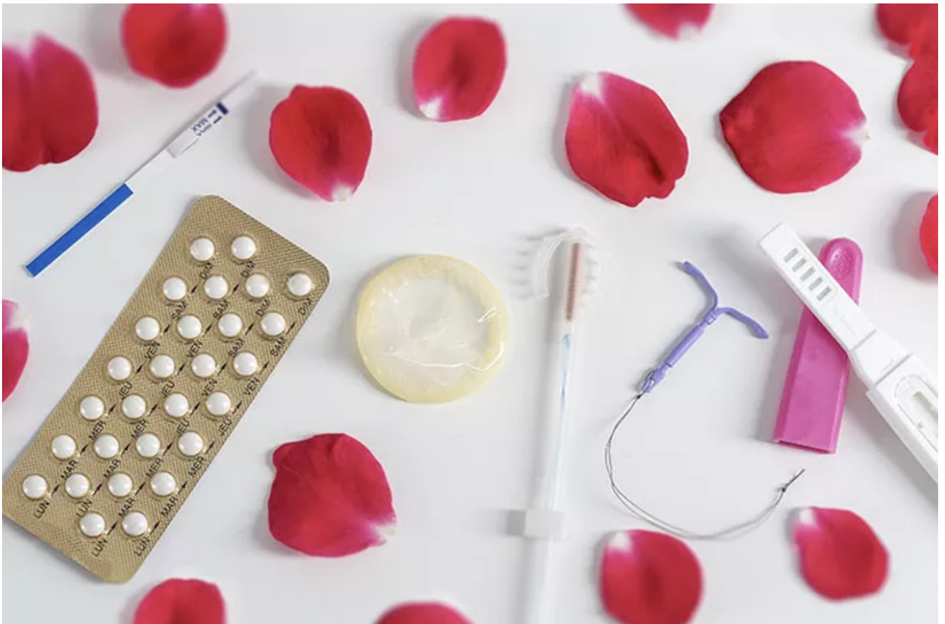
Pengenalan Alat Kontrasepsi - Halodoc

Jejak sejarah Hari Kontrasepsi Sedunia dapat ditelusuri hingga tahun 2007 ketika sepuluh organisasi internasional keluarga berencana bersatu untuk meluncurkan kampanye global yang mengedepankan kesadaran akan kontrasepsi.