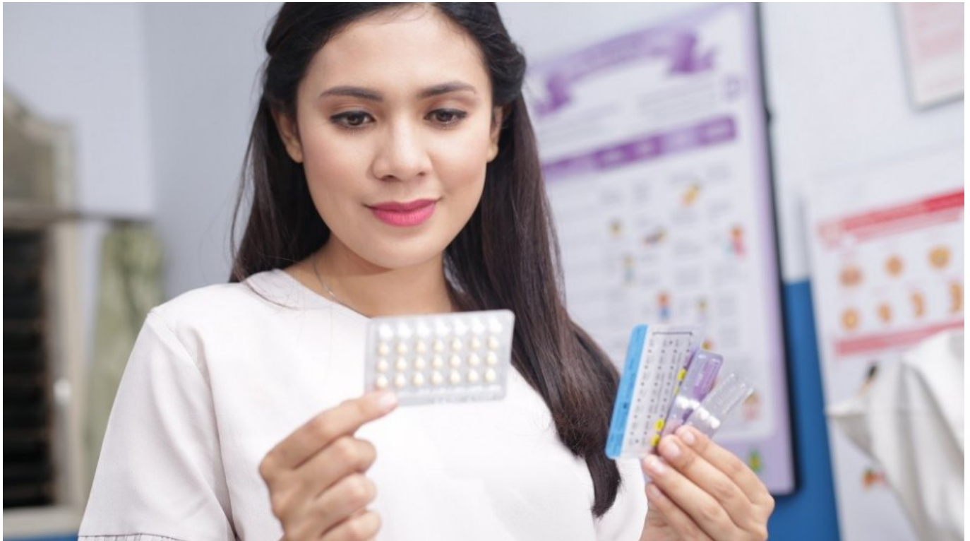
Ilustrasi pentingnya penggunaan alat atau obat kontrasepsi - DKT Indonesia

Kontrasepsi adalah kunci untuk mencegah kehamilan yang tidak diinginkan dan memiliki dampak positif yang signifikan dalam berbagai aspek kehidupan. Berikut adalah beberapa alasan mengapa kontrasepsi sangat penting: