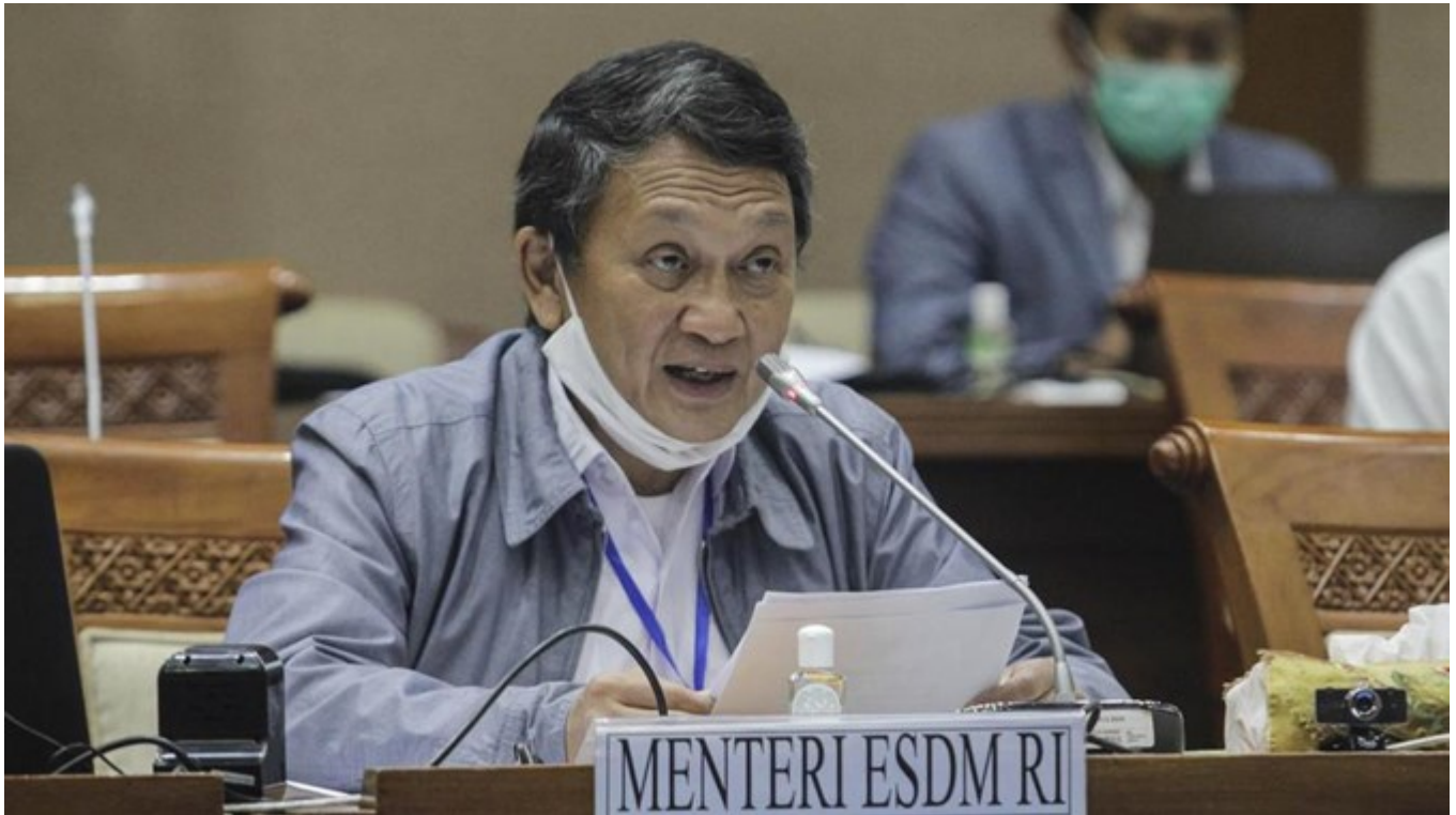
Menteri ESDM Arifin Tasrif

“Diperlukan penyelenggaraan persetujuan penggunaan air tanah sebagai perangkat utama pengendalian dan pengambilan air tanah untuk menjaga konservasi air tanah,” bunyi pertimbangan pada aturan tersebut.