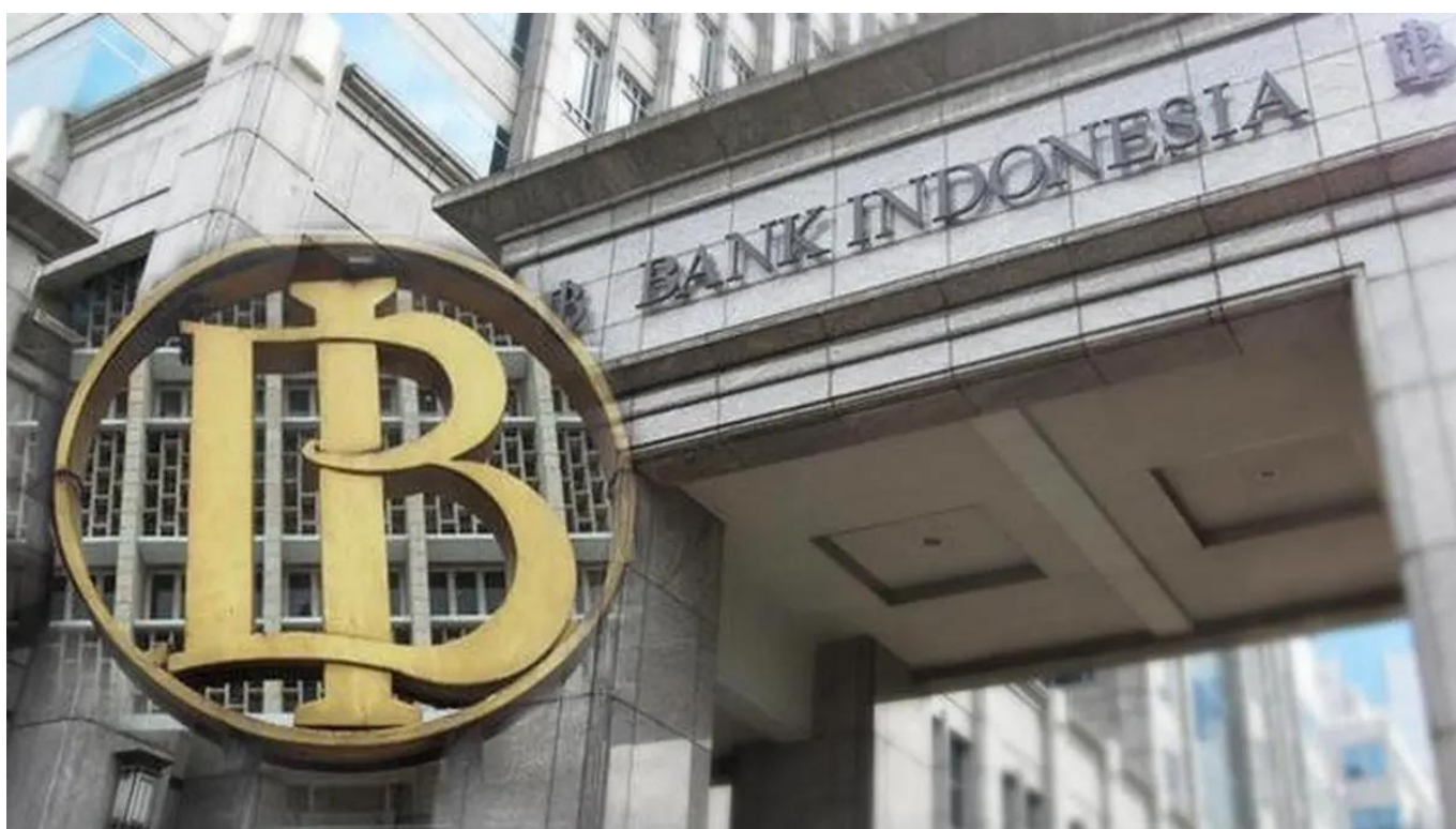
Ilustrasi Bank Indonesia

Hal ini menunjukkan bahwa sektor penjualan eceran tetap tangguh ditandai dengan pertumbuhan positif pada Subkelompok Sandang dan Kelompok Suku Cadang dan Aksesori.