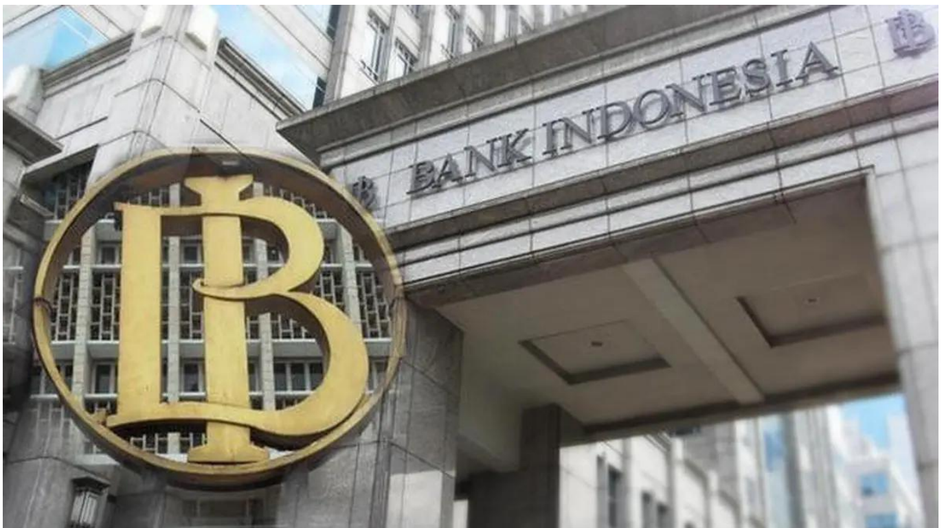
Ilustrasi Bank Indonesia

Hal ini menunjukkan bahwa sektor penjualan eceran tetap tangguh ditandai dengan pertumbuhan positif pada Subkelompok Sandang dan Kelompok Suku Cadang dan Aksesori.