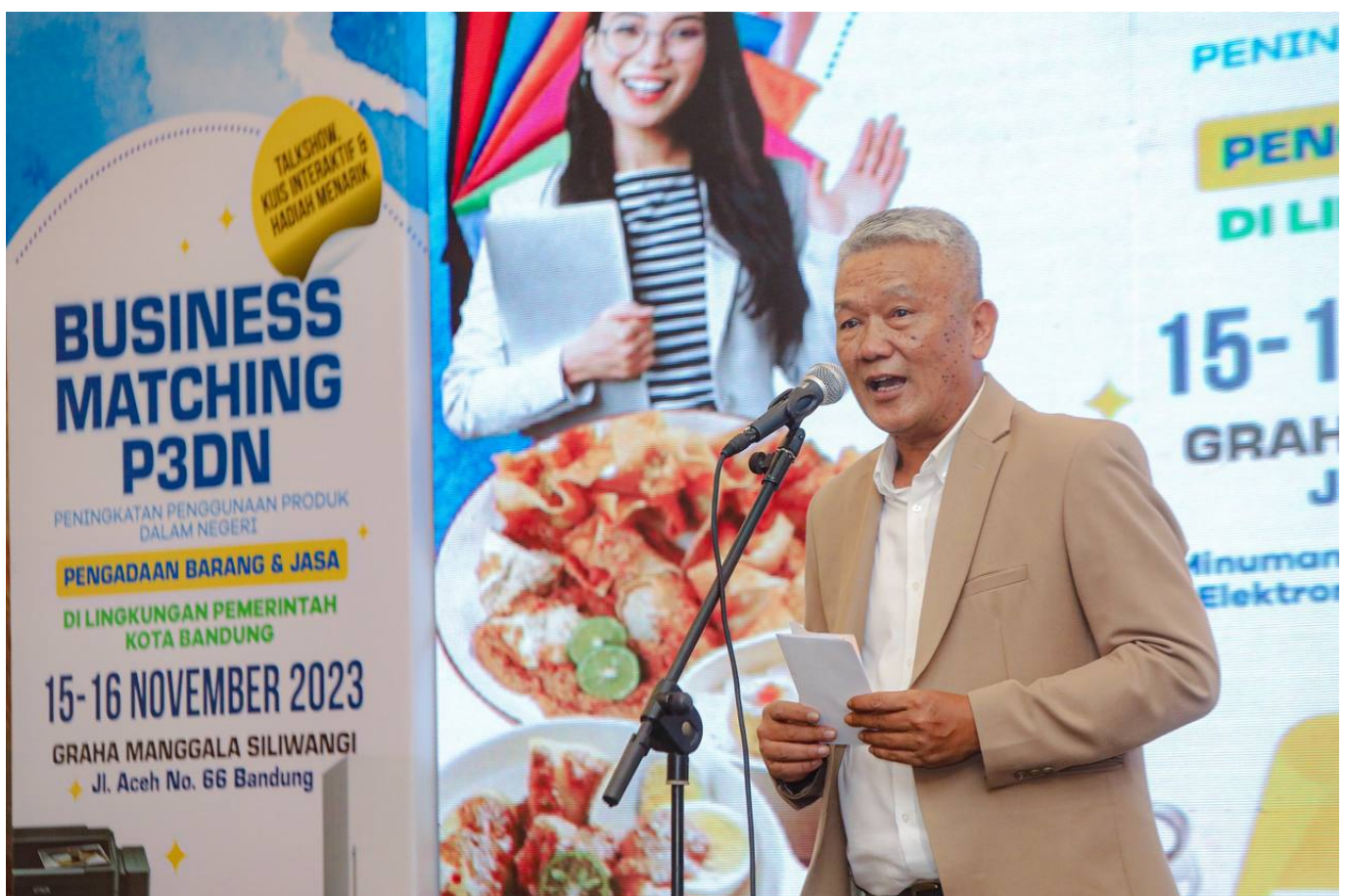
Pj Wali Kota Bandung Bambang Tirtoyuliono

Penjabat Wali Kota Bandung, Bambang Tirtoyuliono menyampaikan ia mendorong seluruh jajaran di Pemkot Bandung untuk meningkatkan penggunaan produk dalam negeri.